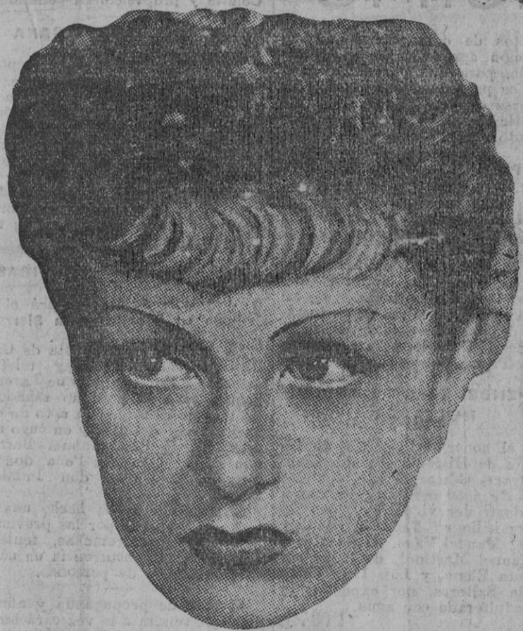
Los bellos rostros del cine.—Danielle Darrieux.

Como ya no es posible retroceder en el camino iniciado, esta vez la manumisión del campesino será un hecho cierto, y conforme avanza el tiempo y la obra de estructuración de la nueva España se vaya logrando, la República contará con este ejército civil de los labriegos españoles, con el que tendrá su máxima garantía y defensa.