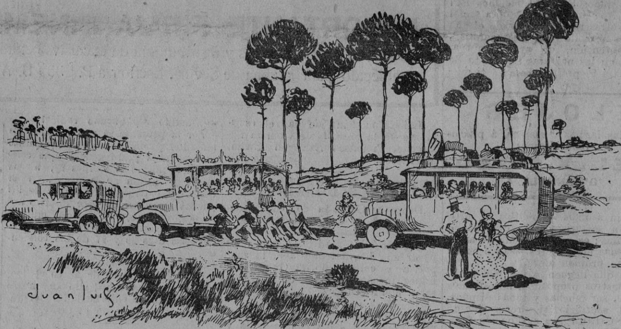
La novedad rociera de este año: En los arenales, ¡todos a empujar!