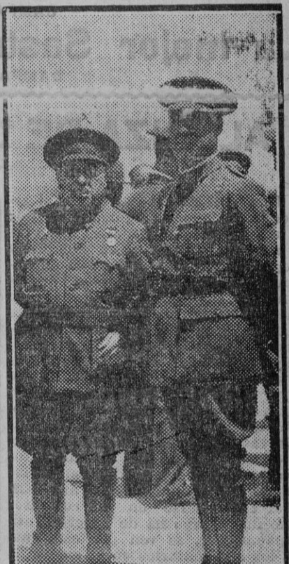
El general Romerales, que ha sustituido al general Caballero en el mando de la brigada de Infantería, asistiendo con otros jefes a las prácticas militares de Carabanchel.