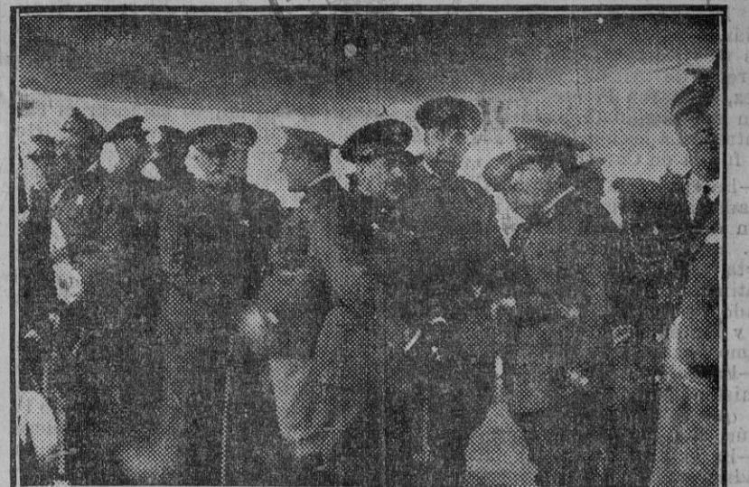
Del incidente militar de Carabanchel. El general de brigada D. Carlos Masquelet Lacasí, que ha sustituido al general Goded en el cargo de jefe del Estado Mayor Central, conversando con otros jefes, durante las maniobras de Carabanchel