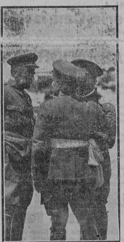
El general don Virgilio Cabanellas, que se ha hecho cargo del mando de la primera División, por relevo del general Villegas, con otros jefes en las maniobras militares de Carabanchel.