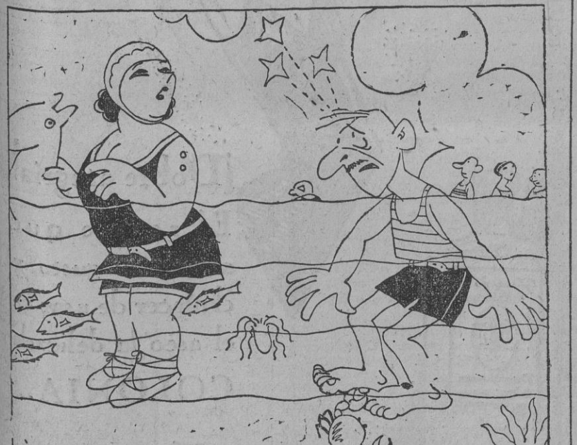
—Ay, Clarita, qué dolor tan fuerte estoy sintiendo en el gordo del pie! —Eso es reumático. ¿Y qué es lo que sientes? —Una cosa así como si me estuviera mordiendo un cangrejo.

Enrique Polo de Lara ESTE NUMERO HA SIDO VISADO POR LA CENSURA