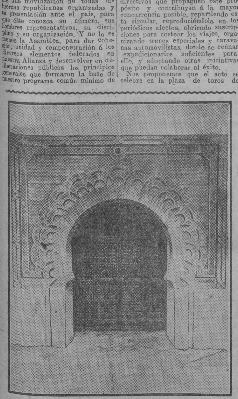
Santa Catalina restaurada: Puerta principal de la Mezquita, verdadera joya de la arquitectura árabe-almoahade, descubierta y restaurada por el señor Talavera

Madrid 14.—La "Gaceta" de hoy publica las siguientes disposiciones: Real orden declarando oficial el XIV Congreso Internacional de Oftalmología que se celebrará en Madrid durante el mes de Abril de 1930.