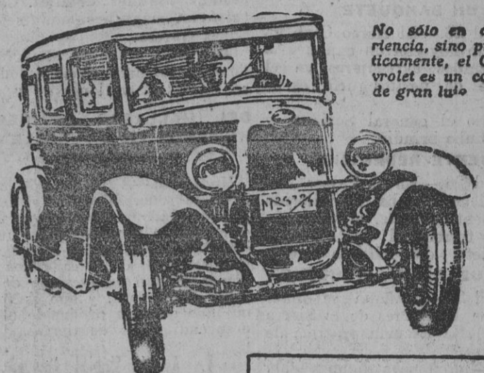
No sólo en apariencia, sino prácticamente, el Chevrolet es un coche de gran lujo

Hoy que tan fácilmente puede serlo dado el precio sorprendentemente bajo del Chevrolet 1928