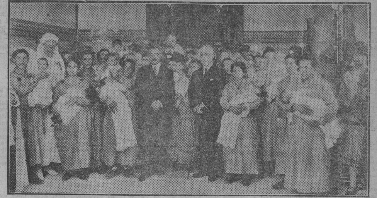
El Alcalde y el Presidente interino de la Diputación, en la inauguración, celebrada esta mañana, del comedor para madres lactantes, instalado en uno de los pabellones del edificio de la Cruz Roja y costeados por la Cámara Oficial de Comercio.