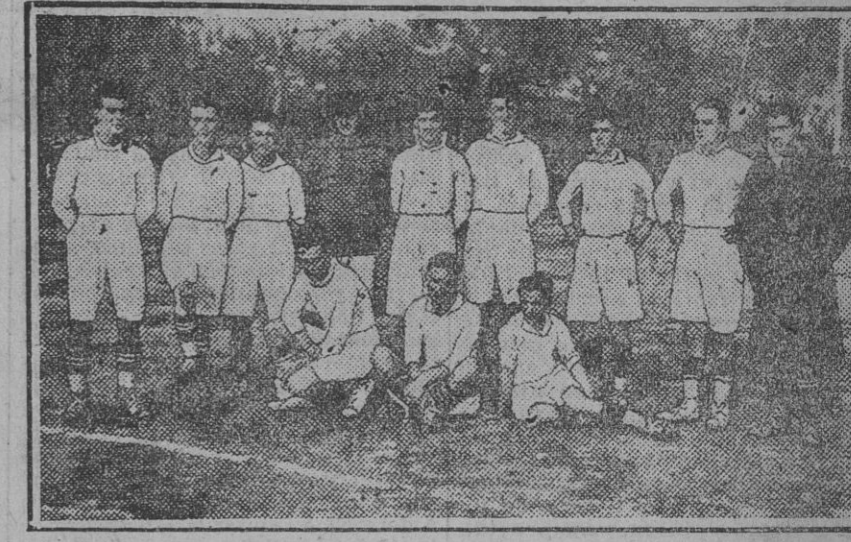
El equipo del «Malagueño F. C.», vencido ayer en el campo del «Sevilla» por el campeón andaluz por un resultado de cuatro a cero.