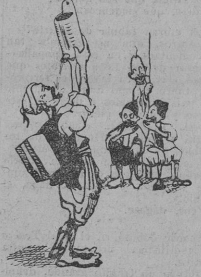
¡Cada uno bebe donde puede!

avión y no recordamos del hoy simpático poblado español más que el enorme empasante que existe al lado derecho de la carretera, frente a la casa aspillada desde la que tantas veces se habrán hecho fuertes sus moradores. Eso y una copia flamenca que canturreaba un soldadito nuestro, caballero en un burro moruno, copia triste, como está mariana de Octubre y este poblado de Arzila envuelto por la bruma del mar y este cementerio de españoles, cuajado de cruces y lápidas blancas, última ofrenda llegada de España para los que, de España vinieron animosos y alegres y aquí quedaron para siempre. El auto corre ahora tanto como lo empuja nuestro deseo de huir de la trágica visión del cementerio español de Arzila. Y aquello que se ve a lo lejos es Larache... GALERIN.