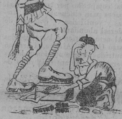
¿Por donde te meto mano, hijo de Alah?