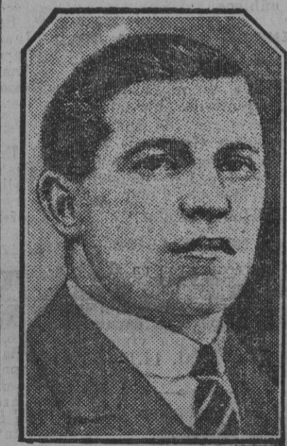
El comandante belga Maseaux, que ha batido el "record" de velocidad durante las pruebas celebradas recientemente en Vauville.