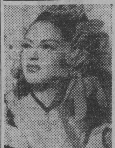
La bellisima cantante Lina Valls, primera figura del "Mogador" parisien, que anoche triunfó clamorosamente en el teatro Cómico