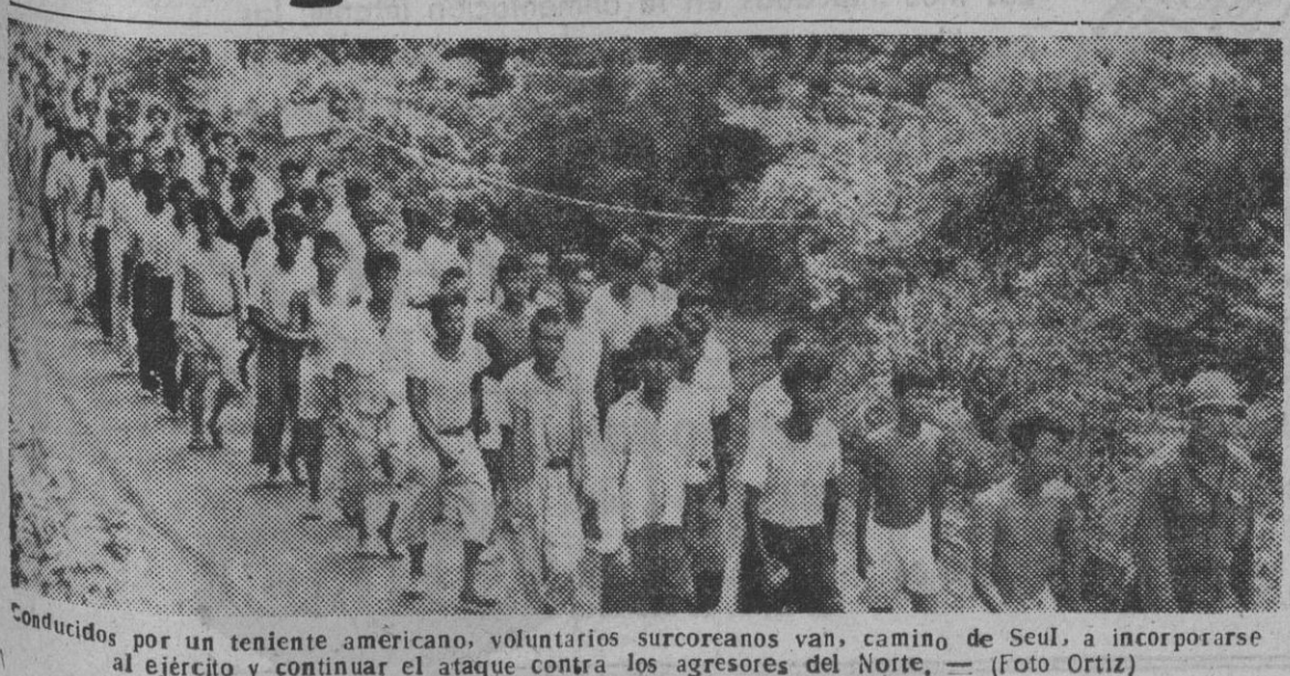
Conducidos por un teniente americano, voluntarios surcoreanos van camino de Seoul, a incorporarse al ejército y continuar el ataque contra los agresores del Norte.