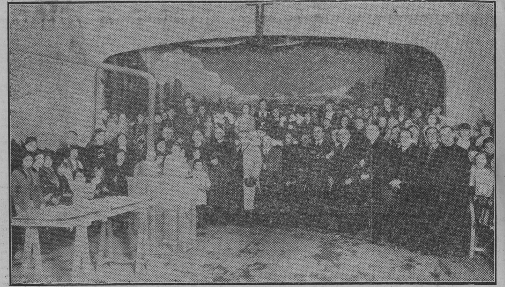
Vista parcial del comedor de la cantina escolar del grupo de San Francisco al mediodía de ayer.

Las autoridades y el Patronato de la benéfica institución la presenciaron ayer en tres grupos escolares