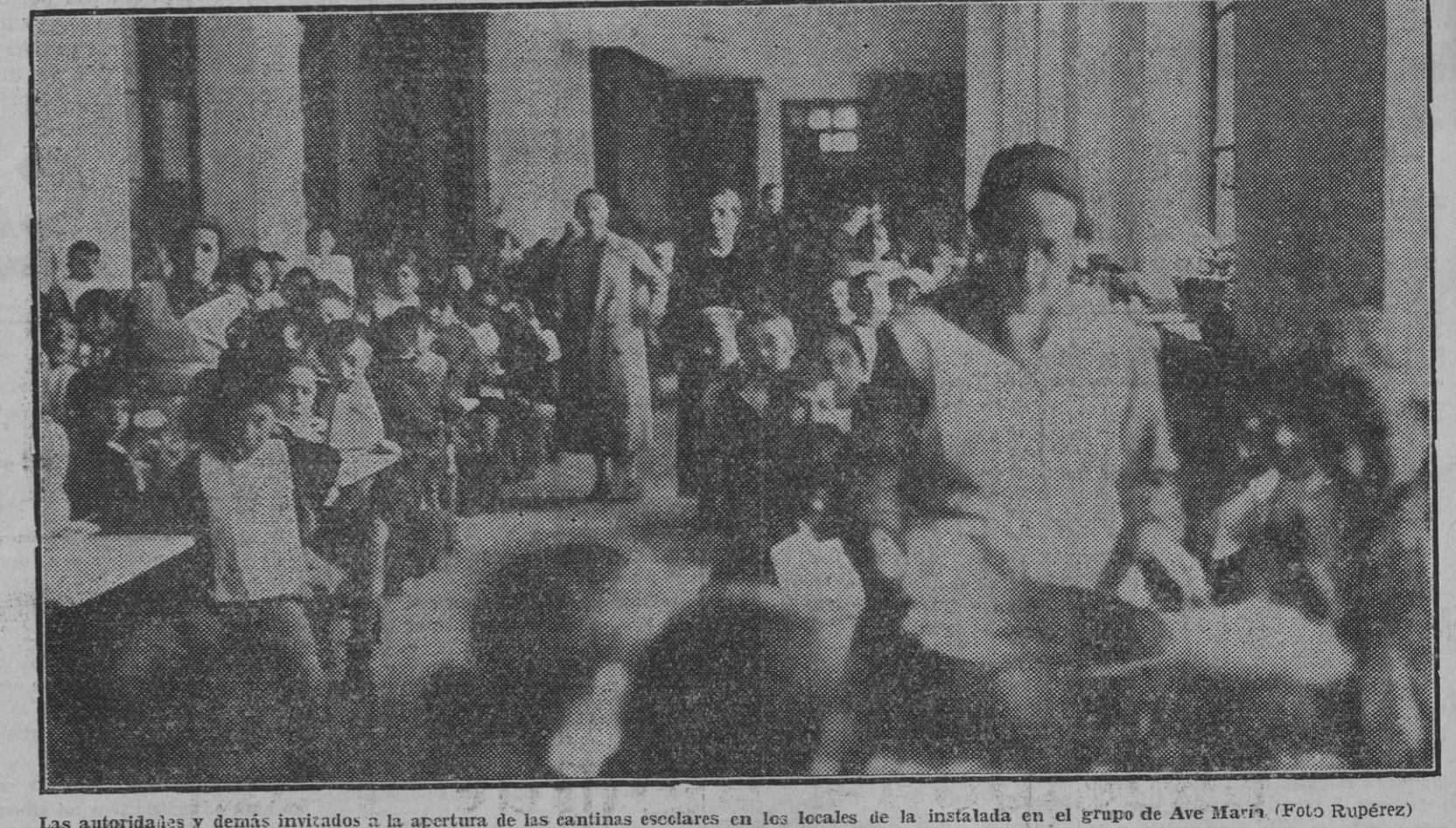
Las autoridades y demás invitados a la apertura de las cantinas escolares en los locales de la instalada en el grupo de Ave María.