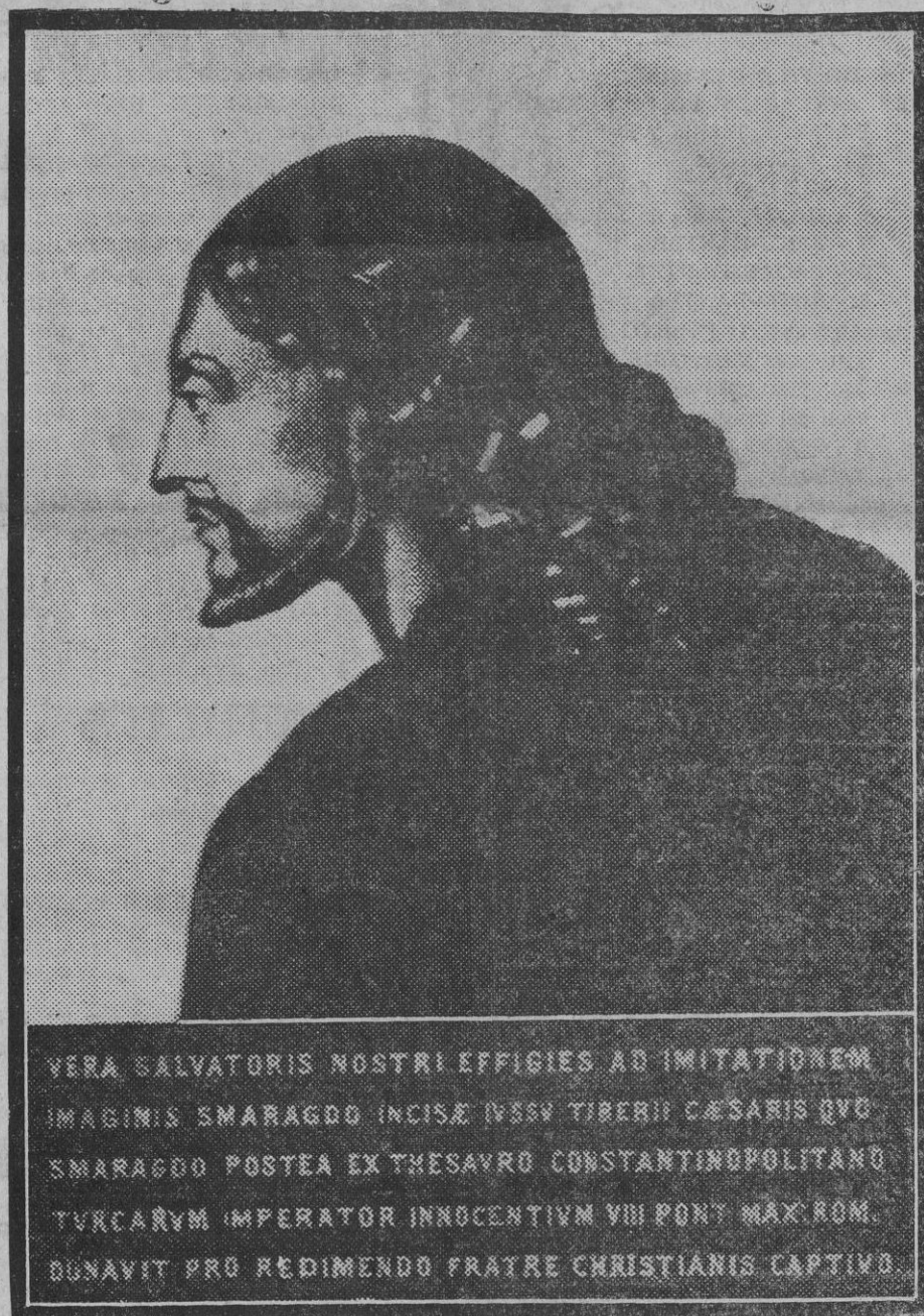
Verdadero retrato de Nuestro Salvador, imitación de la imagen grabada en esmeralda por mandato de Tiberio César, esmeralda más tarde suada del archiepo de Constantinopla y regalada por el embajador turco al Pontífice Romano Inocencio VIII para la redención de un hermano captivo por los cristianos.

Y, por fin, se acordó igualmente que en el terreno de la táctica y para salvar las dificultades que se puedan presentar y en especial las derivadas de una disgregación o parcial acoplamiento de esfuerzos y aun obligados informes, Vizcaya, consecuente con su práctica anterior de hacer labor serena y positiva pro-ferrocarril, agote, como hasta ahora, la manifestación de su buena disposición para la unidad de acción, oficial y oficiosa, que se considere imprescindible para el definitivo éxito, en forma que, de no ser alcanzado éste, o que por demora en llegar a aquel acoplamiento (que no tiene que ser grande para producir un gran retraso), no se consiga la línea o quede aplazada notablemente su consecución, con evidente perjuicio para el país, no solamente no pueda alcanzar a Vizcaya ni la menor sombra de responsabilidad, sino que pueda quedar bien documentada la causa de tal fracaso.