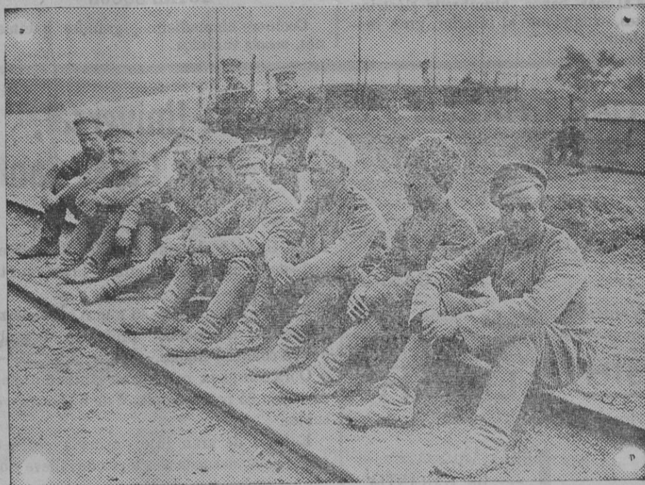
Un descanso de soldados rusos hechos prisioneros en la batalla de Augustov.

Sigue enfermo, aunque no de gravedad, por fortuna, el jefe del partido so-