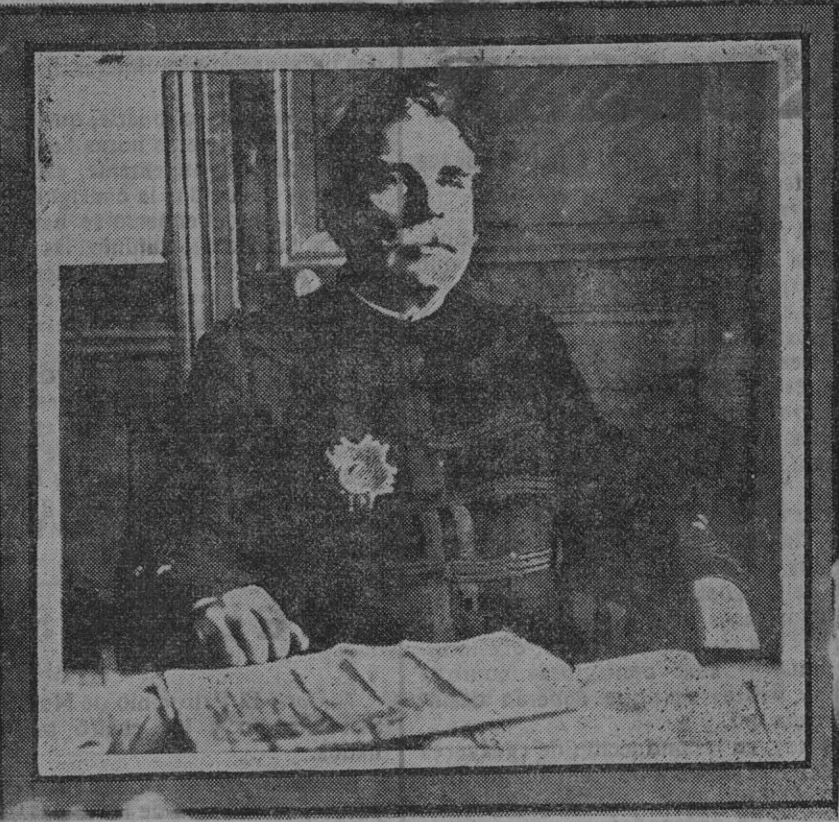
EL GENERALISIMO JOFRE EN SU GABINETE DE TRABAJO

Los franceses han puesto en práctica una estrategia que les ha dado buenos resultados. Construyen con troncos de árboles, imitación de cañones de 75 centímetros. Los tombes los ven y lanzan sobre ellos las bombas.