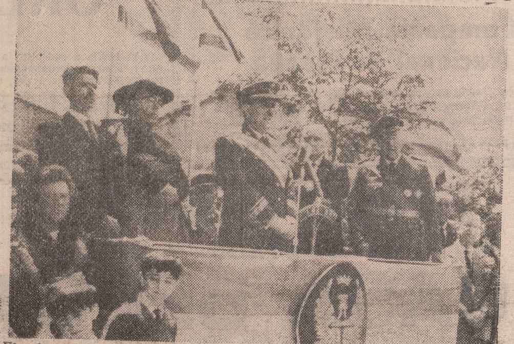
El gobernador militar, general García Díez, pronunciando su vibrante arenga la conmemoración del domingo en dicha villa.