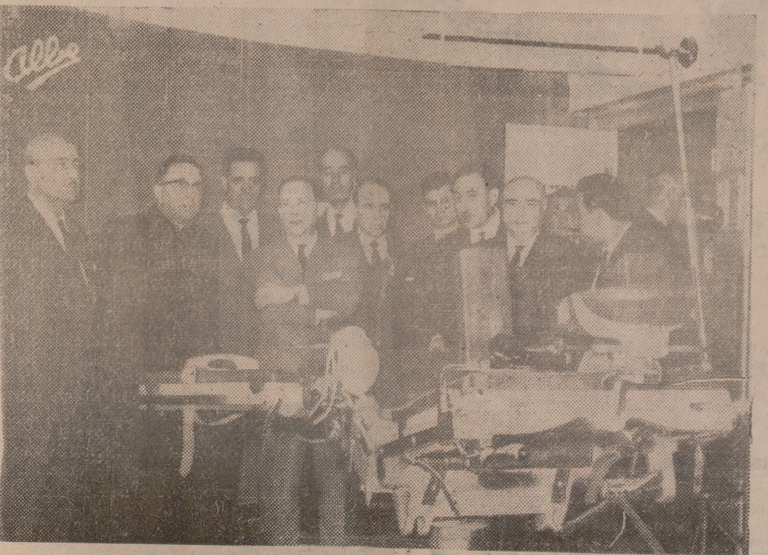
Nuestras primeras autoridades visitan el quirófano número 1.