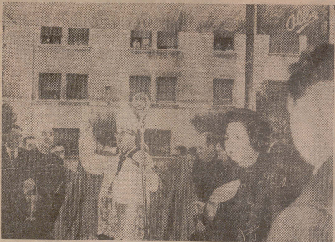
Momento en que el Rvdmo. señor obispo de la diócesis bendijo el nuevo edificio.