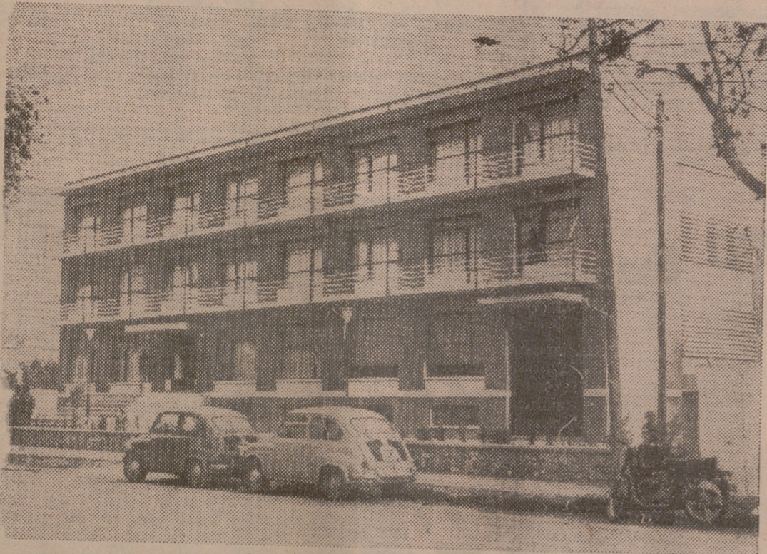
Vista general de la Clínica Velázquez, sita en Avenida del Club Deportivo.

Con asistencia de los señores gobernadores civil y militar y del Rvdmo. señor obispo de la diócesis, acompañados de todas nuestras autoridades y numerosos invitados, entre los que figuraban la casi totalidad de los médicos residentes en Logroño —capital y provincia—, el pasado sábado, a las siete de la tarde, fue inaugurada la Clínica Velázquez.