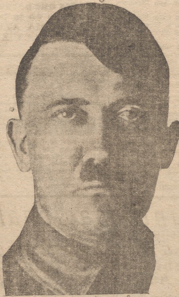
El Führer-Canciller, Adolfo Hitler, que una vez más ha demostrado sus dotes de estadista genial, al realizar, en el transcurso de pocas horas, la unión de Austria con Alemania, suceso que ha conmovido profundamente al mundo.

—Yo le aseguro, siguió diciendo el Führer, que hace cuatro días no pensaba en los acontecimientos que se han desarrollado. Tomé esta decisión porque el señor Schussnigg me defraudó y esto yo no lo tolero. En la entrevista que tuve con el señor Schussnigg, le pedí que cesara la persecución y martirio de que era víctima el pueblo austriaco. Era la oportunidad de seguir. Schussnigg me prometió que mis deseos serían cumplidos, pero en vez de hacerlo, trató de formar ese plebiscito. De momento no podía creer lo que oía. Envié un ministro a Viena para que se enterase del verdadero estado de las cosas. Después de ser informado sobre