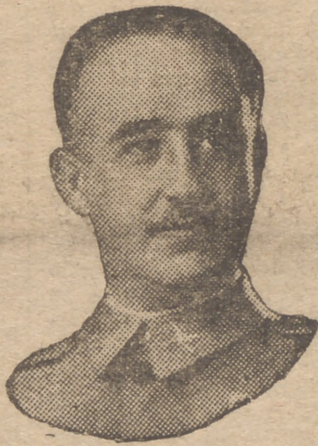
FRANCO FRANCO FRANCO UNA NOTA