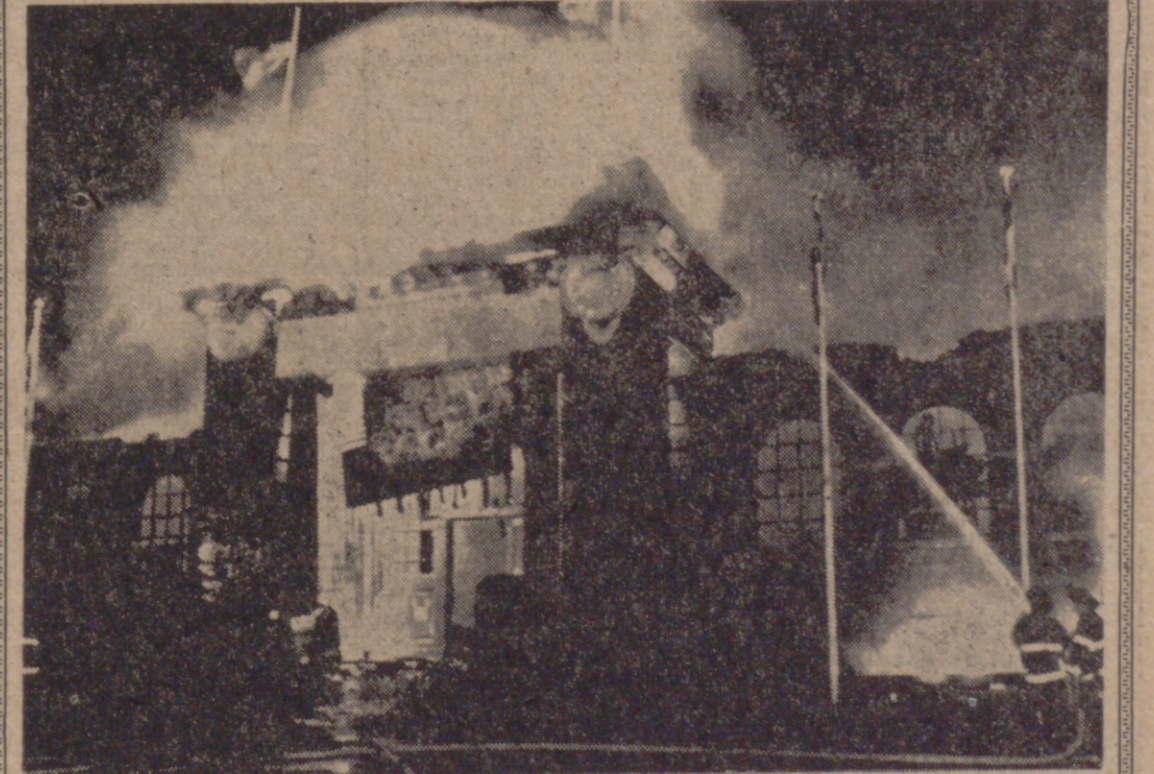
TORONTO.—Obras de arte españolas exhibidas en esta ciudad, por valor superior a los 1.500 millones de pesetas, fueron destruidas el sábado por un enorme incendio que destruyó el Edificio Internacional, que data de hace sesenta y cinco años, en los terrenos de la Exposición Nacional Canadiense.