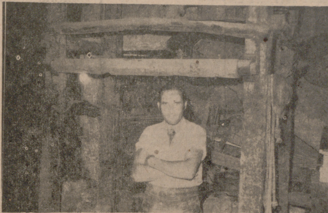
El herrador, ante el potro donde se hierren los bueyes.

Varios personajes he traído a las páginas de este periódico, representantes de oficios que se perderán irremisiblemente o que conservarán una débil existencia a lo largo de un periodo corto de tiempo. Hoy toca el turno al herrador forjador.