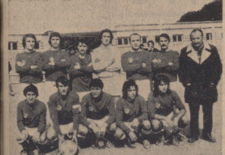
El At. Valladolid, que cerró con un empate la temporada.

La Segunda Categoría Regional do en el día de ayer fin a su temporada. Quedaba por disputarse la última jornada de los grupos segundo y cuarto, y si en el grupo segundo esta última jornada era de puro trámite, en el grupo cuarto quedaba aún por decidirse el campeón.