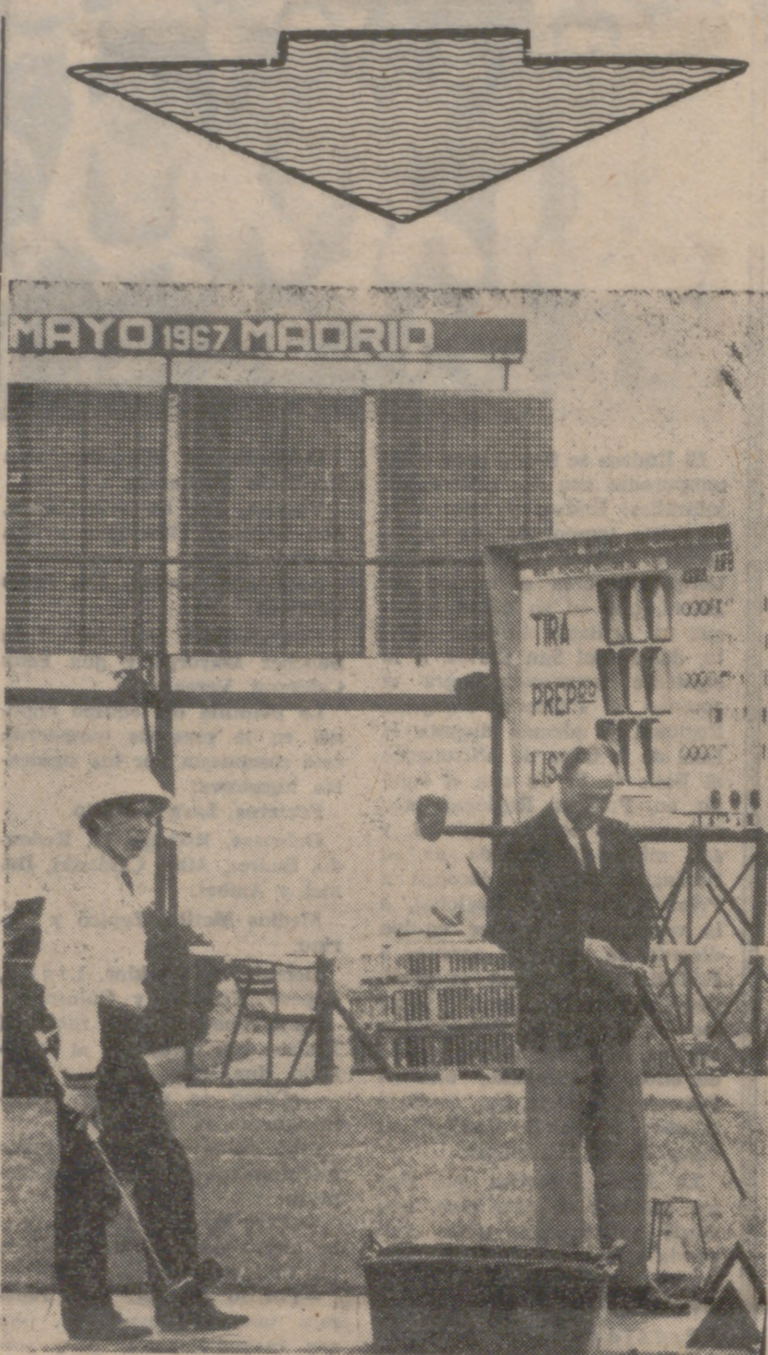
El Conde de Teba, figura legendaria del tiro de pichón en España. En 1931 ganó por primera vez la Copa de España, en la que volvió a inscribir su nombre por séptima vez en 1965. Es el primer español campeón del mundo, título que ganó en 1953. Tres años después fue campeón de Europa y aún sigue tirando y ganando.

Indudablemente, en torno a este deporte hay otros intereses, porque además de las escopetas están los cartuchos y los pichones. En España, hoy, es negocio auténtico la cría de pichones. La raza "zarra" es muy apreciada, por su fuerza, por su vuelo decidido, y en el mundo son solicitados los pichones españoles. La mayor parte de la producción, cada día en aumento, se consume en España; pero también se exportan muchos miles de pichones al año a otros países, y principalmente a Italia, en donde el tiro de pichón es un deporte de gran raigambre, de mucha fuerza y que cuenta con tiradores de calidad mundial. En España se fabrican escopetas que nada tienen que envidiar a las mejores del mundo. En Eibar se hacen auténticas joyas; pero no es sólo eso, sino que el nivel medio de las escopetas que aquí se fabrican es magnífico y también se exportan. En cuanto a los cartuchos, puede decirse lo mismo. Tenemos, pues, de todo en cuanto a material, sin olvidar que las instalaciones distribuidas por toda España, nada tienen que envidiar a las mejores del extranjero y, sin falsa modestia y sin triunfalismos, podemos asegurar que muchas de nuestras so-