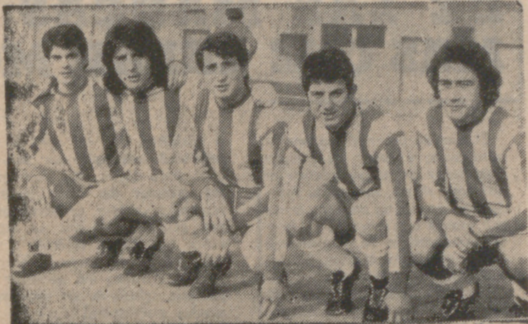
Mucho tendrá que superarse la vanguardia del Racing para dar la vuelta al marcador en el partido de vuelta.

Alineaciones: RACING VALLADOLID: Vega, Mauri, Angel, Losa; Acuña, Solete II; Alvarez, Gómez, Gil, Pichi y Villahoz. (Benito y Alvaro). C. D. SAVA: Antonio; Román, Gellio, Boni; Bravo, Coca; Del Valle, Vaquero, Marcelo, Rusillo y Esteban. (Celes y Maroto).