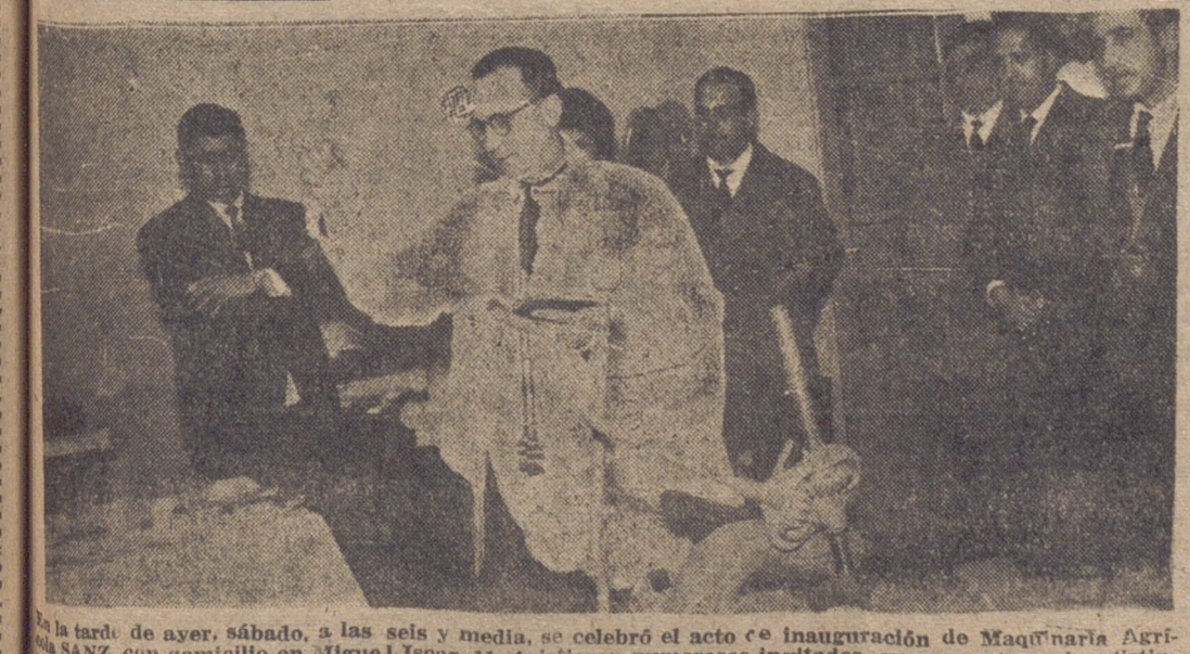
En la tarde de ayer, sábado, a las seis y media, se celebró el acto de inauguración de Maquinaria Agrícola SANZ, con domicilio en Miguel Iscar, 11. Asistieron numerosos invitados, que recorrieron las distintas dependencias y la sala de exposición de maquinaria agrícola, avícola e industrial. En la fotografía, un momento del acto.