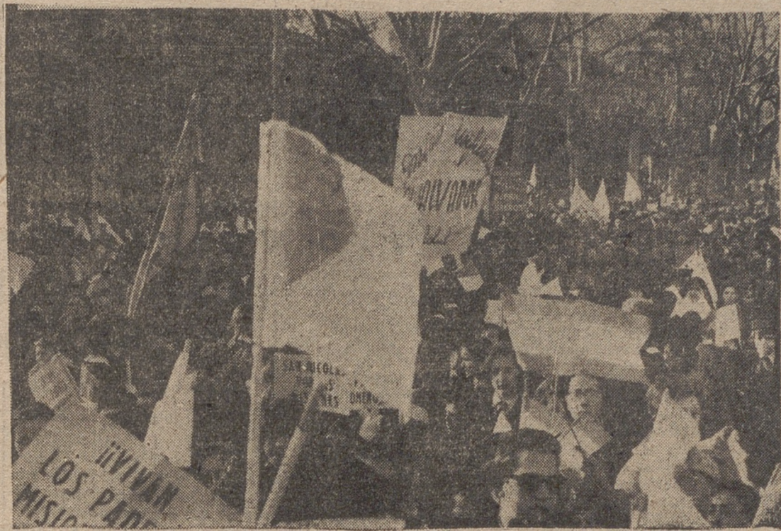
UN ASPECTO DE LOS ESCOLARES CONCENTRADOS EN EL PASEO CENTRAL DEL CAMPO GRANDE, EN EL ACTO FINAL DE LA MISION INFANTIL