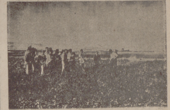
Los cursillistas de Tudela de Duero en una de sus clases prácticas, en Retuerta.

"Les agradecemos sus preocupaciones por el campo"