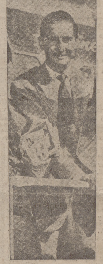
Nueva York, 21. (Madrugada). — El cirujano e hijo del jefe del Estado Español, marqués de Villaverde, ha salido en avión de la Iberia para Madrid, a las 21,23 de esta noche (hora G. M. T.), después de haber pasado tres meses en Estados Unidos.—Efe.

Le recibieron la esposa del Caudillo y la marquesa