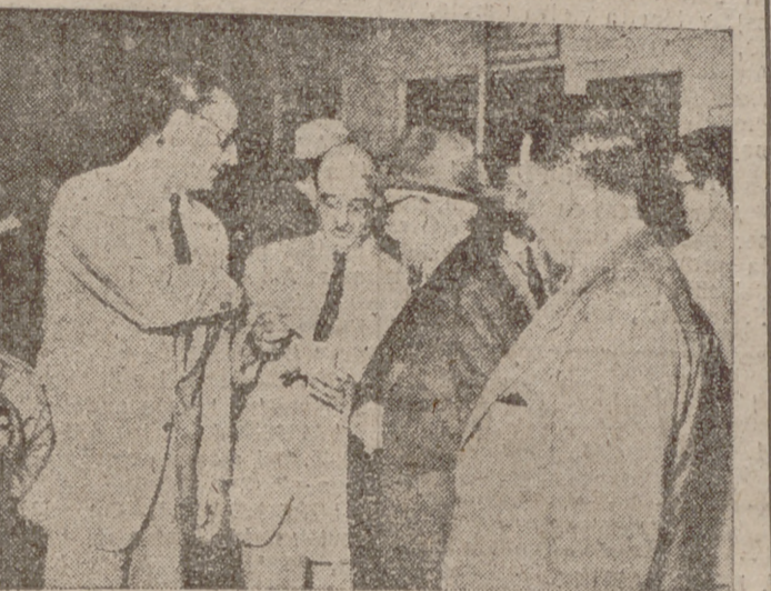
A su llegada al aeropuerto de Barajas, el profesor Warkman, descubridor de la estreptomizina, es recibido por los miembros de la Comisión organizadora del Congreso de la Unión Internacional contra la Tuberculosis.