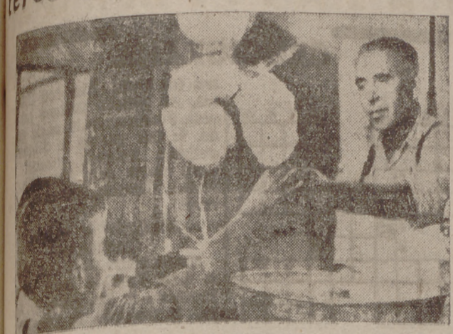
Una de las típicas casetas de la feria. Los chicos se disputan el clásico "algodón en rama".

Un tiempo envidiable—ya lo sabemos haber tenido así hace un siglo—amanece el tercer día de FERIA y fiestas. Parece un día que no se habla cuando no se tiene que hablar, se convierte en un tiempo tan importante al trascorrer la mitad de septiembre. Peleamos, y por tanto, debemos traerlos con la debida deferencia. En las primeras horas del día las calles de la ciudad presentaban la alegre animación de los días de nuestros antepasados y vecinos—siempre mancomunados y vecinos—siempre mancomunados y vecinos para divertirse—y a las primeras horas de la mañana la ciudad presentaba la alegre animación de los días de nuestros antepasados y vecinos—siempre mancomunados y vecinos—siempre mancomunados y vecinos para divertirse—y a las primeras horas de la mañana la ciudad presentaba la alegre animación de los días de nuestros antepasados y vecinos—siempre mancomunados y vecinos—siempre mancomunados y vecinos para divertirse—