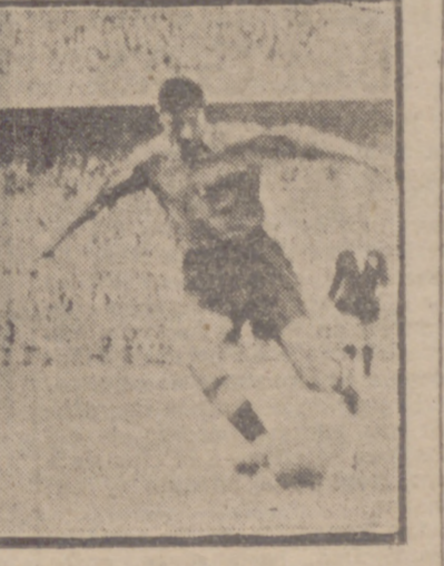
Morro fue en Chamartín el único delantero con ímpetu y brío para buscar en la zona difícil el camino del gol...