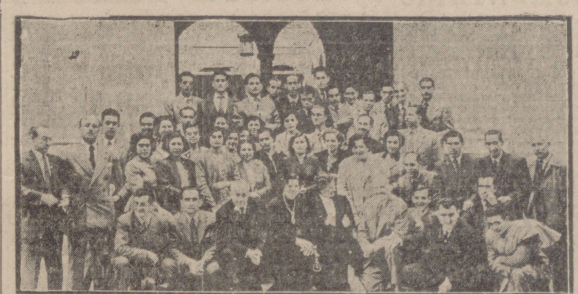
Un grupo de asistentes a la inauguración del Centro de Acción Católica de Sordomudos.