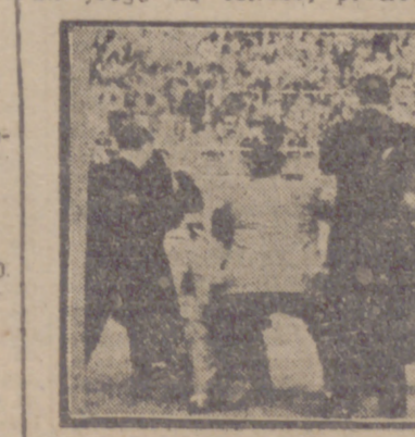
Al Valladolid no le vieron en Madrid; no fue más que una sombra de otras grandes ocasiones...