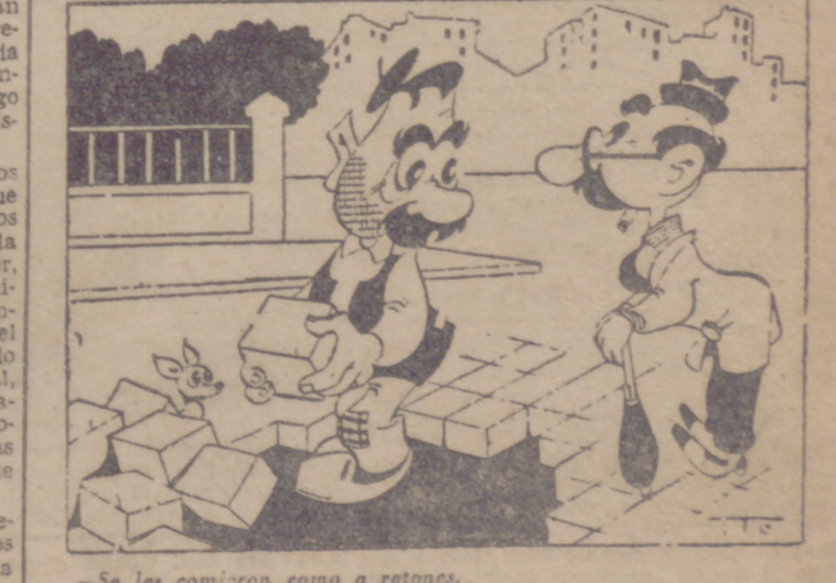
—Se los comieron como a ratones. —Claro; como que jugaban con los 'gatos'!