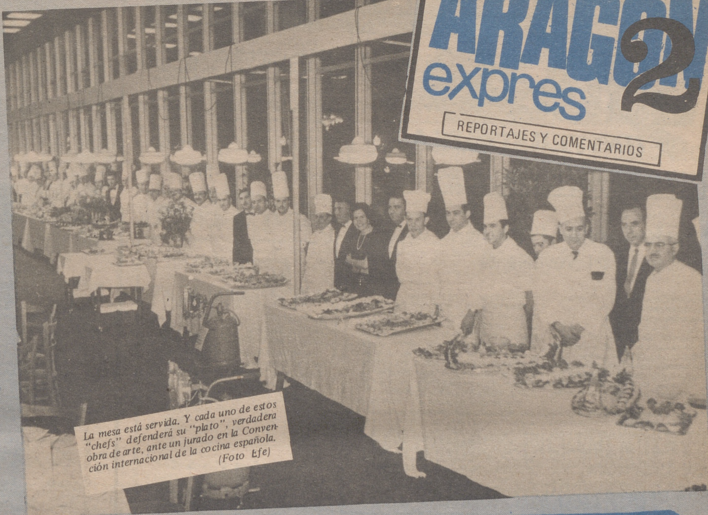
La mesa está servida. Y cada uno de estos "chefs" defenderá su "plato", verdadera obra de arte, ante un jurado en la Convención internacional de la cocina española.

VEINTICUATRO EXPERTÍSIMOS EN COCINA DE TODOS LOS PAISES Y GENEROS, DARAN CLASES A "CHEFS" YA EXPERIMENTADOS EN PARIS Y SE ESPERAN ALUMNOS DE TODOS LOS PAISES, INCLUIDOS LOS QUE SIRVEN AL MIKADO