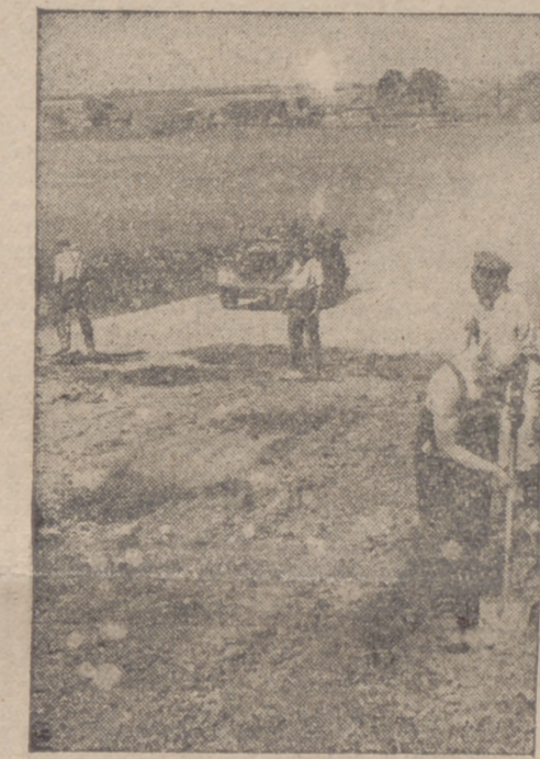
Soldados y zapadores del ejército alemán transforman las rutas soviéticas en carreteras transitables

Próximo a extinguirse el plazo para las publicaciones de los trabajos que han de optar a los premios nacionales de periodismo y literatura "Francisco Franco" y "José Antonio Primo de Rivera", se recuerda a los señores concursantes que, según dispone la Orden del Ministerio de la Gobernación de fecha 8 de febrero de 1941 (B. O. del 20), este plazo termina el 30 de septiembre. Los libros y artículos deberán presentarse por duplicado en la Jefatura de Educación Popular (Monte Esquinza, n.º 2, Madrid) hasta el día 15 de noviembre próximo.