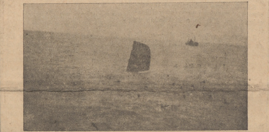
EL HUNDIMIENTO DEL C-3

Al conquistarse Gijón supimos su historia. Aquel hombre hizo honor al nombre glorioso que vestía. Teniente de navío, el Comité de guerra de Asturias lo condena a muerte. Impacientemente, nervioso, aguarda en su celda la hora suprema. No le amedrenta conde