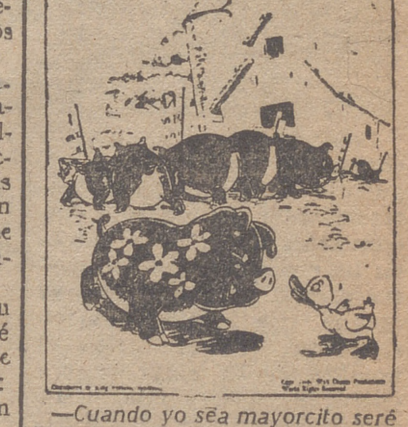
—Cuando yo sea mayorcito seré tanquero. No aspiro a menos. ¿O es que crees que he nacido para esta puerca vida?