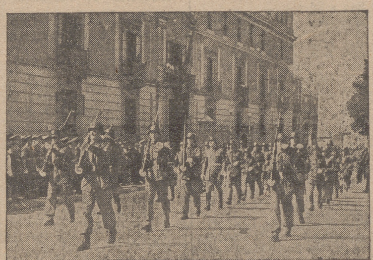
Un momento del desfile de las fuerzas ante Capitanía