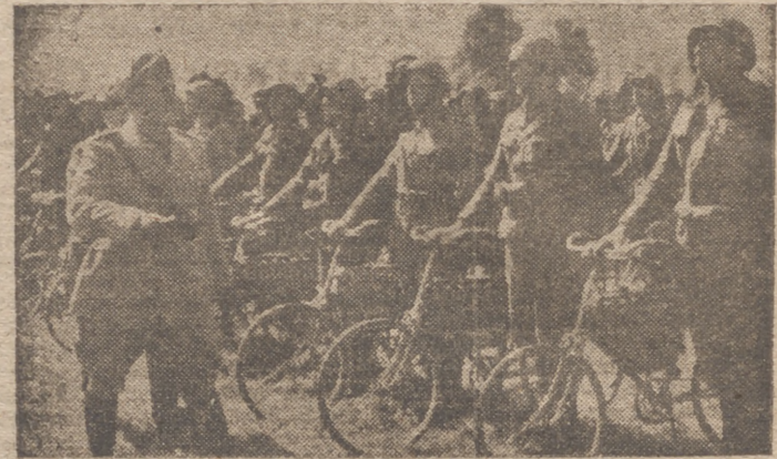
El Duce pasa revista a un grupo de "bersaglieri".

Algeciras, 15.—A las siete menos cuarto de esta tarde ha vuelto a volar sobre Gibraltar un avión. Las baterías antiaéreas dispararon seis veces. El avión se alejó seguidamente hacia el Estrecho.—Cifra.