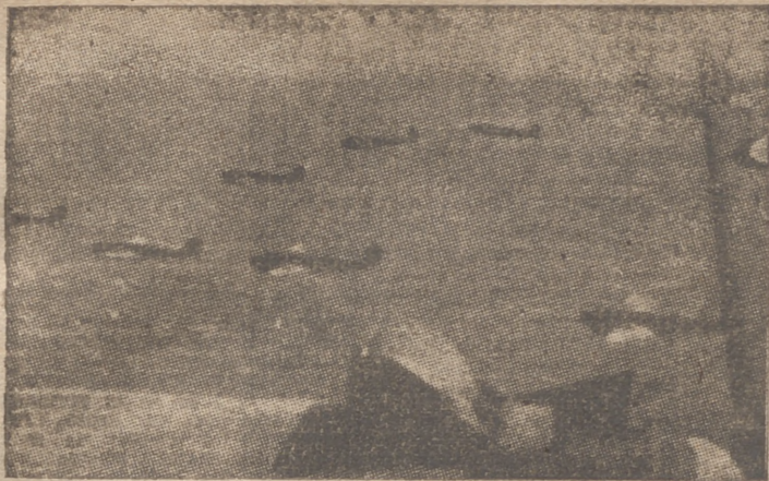
Un vuelo de la aviación italiana hacia objetivos británicos.

«Se ha registrado una ligera actividad aérea enemiga al Sudoeste de Inglaterra y al Sur del País de Gales en la tarde de hoy. Fueron lanzadas algunas bombas. No ha habido ninguna víctima y los daños registrados son de poca consideración.—Efe.