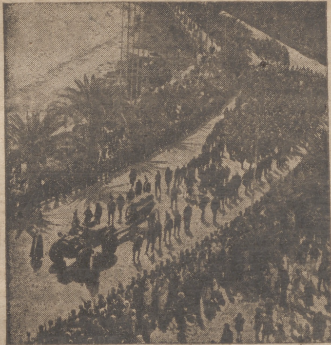
TRIPOLI.—HONRAS FUNEBRES POR EL MARISCAL ITALO BALBO

El coro de naciones que invirtieron inconscientemente sus designios está derrotado, disperso y sin voz. La hora de la verdad suprema ha sonado, y nuestra fe de espafíes ordinarios de justicia debe ser absoluta.