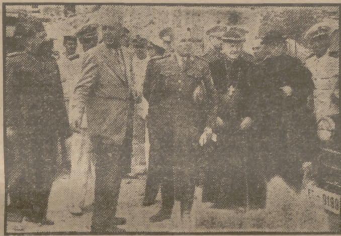
El alto comisario de España en Marruecos, teniente general Varela; el obispo de Cádiz, el alcalde y otros autoridades locales y de la región andaluza durante su recorrido e inspección de la zona afectada por la explosión y los incendios que la siguieron

SEVILLA, 21 (12.30 m.).—Se van conociendo algunos rasgos de heroísmo y abnegación registrados en los momentos más difíciles que siguieron a la catástrofe gaditana. El Ejército del