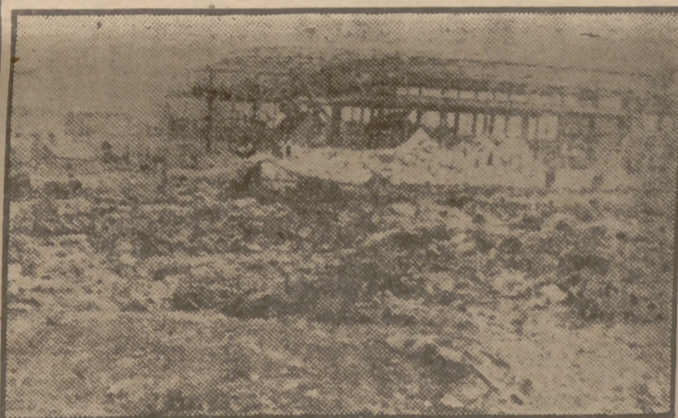
Los astilleros Echevarrieta, que fueron pasto de las llamas, por uno de los varios incendios que estallaron en la zona donde se produjo la explosión de las minas. Los astilleros fueron destruidos totalmente, así como la casa de los Echevarrieta, próxima a la factoría.