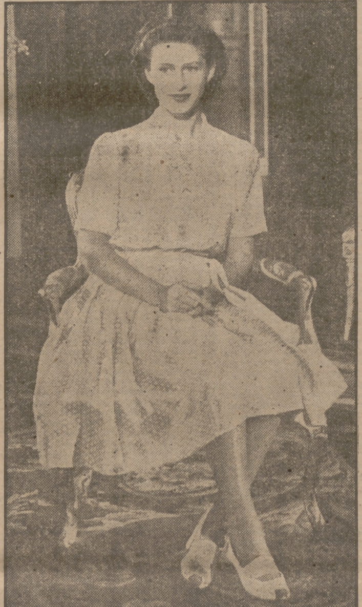
La princesa Margarita, hija menor de los Reyes de Inglaterra, cumple diecisiete años hoy, día 21 de agosto. La foto ha sido obtenida en el Palacio de Buckingham.