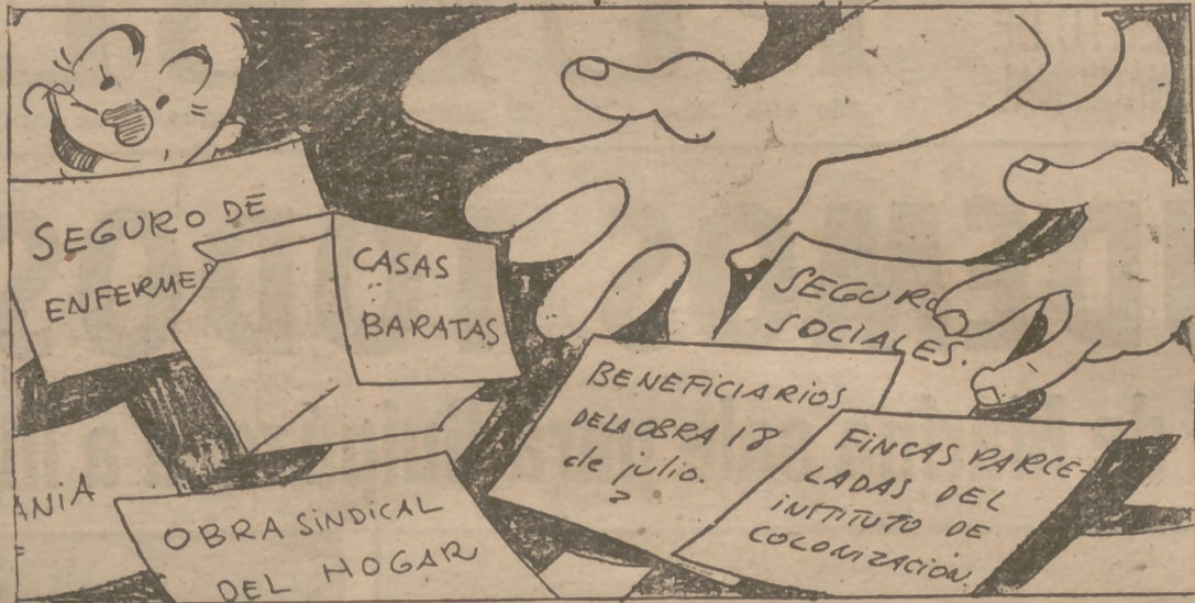
—¡Admirables previsiones que mis males y necesidades remedian!