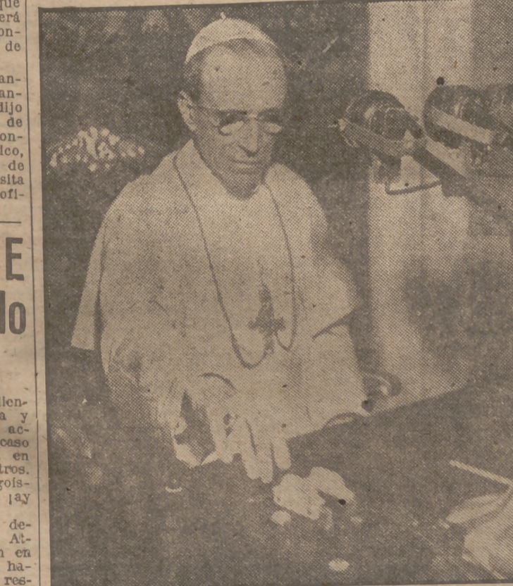
Su Santidad el Papa Pío XII pronunció una alocución dirigida a los fieles de Mesina (Sicilia), con motivo de la festividad de la Virgen. En el mismo acto acojonó la instalación de radio por medio de la cual se iluminó la imagen venerada en Mesina.