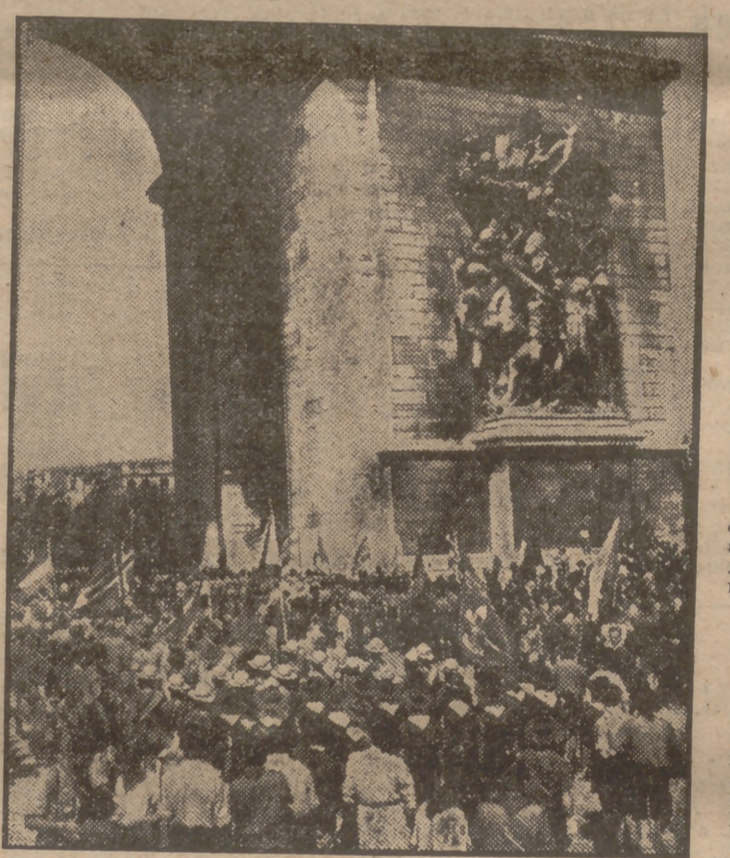
Los "boy-scouts" de distintas nacionalidades concentrados en Moisson asistieron en París a una ceremonia ante la tumba del Soldado Desconocido, bajo el Arco de Triunfo.

Italia. Tengo a mano unas estadísticas del Instituto Nacional. La base de la subida desde 1937 es 100. Transcribo: Italia, 2.676; Francia, 883; Turquía, 354; Bélgica, 330; Checoslovaquia, 308; Portugal, 216; Estados Unidos, 157; Suiza, 155; Inglaterra, 132; Canadá, 128; Australia, 127.