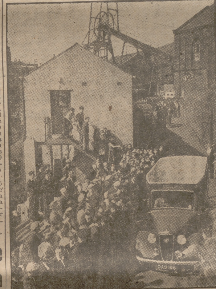
Ante el público estacionado a la salida de la mina siniestrada en Cumberland pasa una ambulancia que transporta a tres obreros heridos. Hasta ahora van retirados ochenta y un cadáveres; y se desconoce la suerte de veintitrés.