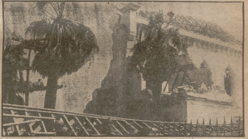
He aquí las primeras muestras gráficas de la catástrofe gaditana. Por ellas se obtiene una más clara idea de las terribles consecuencias del siniestro que ha ensombrecido aquella ciudad alegre y bella y ha llevado el luto y la consternación a toda España, que se duele con los hermanos de Cádiz del trágico suceso del lunes. En la primera foto puede verse la base de defensa submarina en el primer en que ha quedado la edificación a consecuencia de la explosión de las minas, ocurrida en sus proximidades; en el ángulo inferior de la izquierda de la misma fotografía se ven amontonados explosivos intactos. En la derecha, arriba, una vista del Sanatorio de la Madre de Dios, asilo de niños pobres de la ciudad. Y abajo, otra de cómo ha quedado el edificio donde estaba instalado el Instituto Hidrográfico. (Más información gráfica en tercera página.)

El HEROISMO de un oficial minador contribuyó a reducir la dimensión del SINIESTRO Acude el pueblo en masa a los funerales de hoy en la ciudad