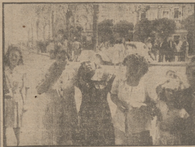
Una de las numerosas víctimas del suceso de Cádiz momentos después de ser asistida con carácter urgente por los servicios sanitarios, que hubieron de trabajar sin descanso durante muchas horas de búsqueda incesante por la ciudad sumida en tinieblas