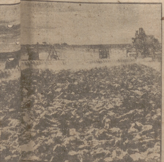
es por hora se puede arar un terreno por que especial, inventado por dos tejanos: de Duma...