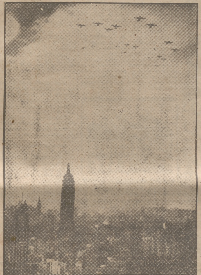
Más de cien bombarderos aparecieron en el cielo de Nueva York haciendo "víctima" a la gran ciudad de un ataque con todos los medios modernos de destrucción. Los habitantes, al ver sobre el Empire State las flotas de fortalezas volantes, debieron de sentirse sobrecogidos pensando en que algún día este simulacro de las propias fuerzas del aire fuera llevado a cabo por la única nación que hoy en el mundo preocupa a Rusia.