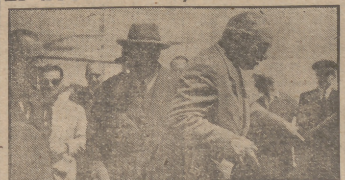
A las doce y diez de esta mañana ha marchado a Barcelona en avión especial el representante de la Argentina en la O. N. U., doctor Arce, que allí será recibido por Su Excelencia el Jefe del Estado. Con el señor Arce viajan los ministros de Asuntos Exteriores, Hacienda y Obras Públicas.