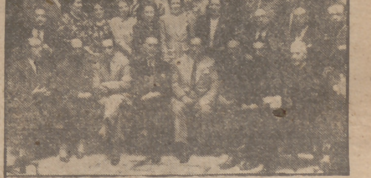
Componentes de la Misión cultural portuguesa constituida por profesores y alumnos del Colegio Oficial Español de Oporto, que han visitado Cádiz.

También salió para Roma en el mismo aparato la madre de nuestro embajador en la Ciudad Eterna, señor Sangroniz.