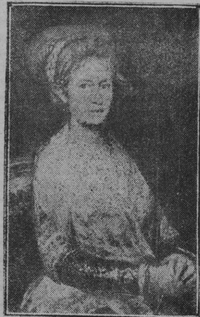
Retrato de Josefa Bayen, esposa de Goya