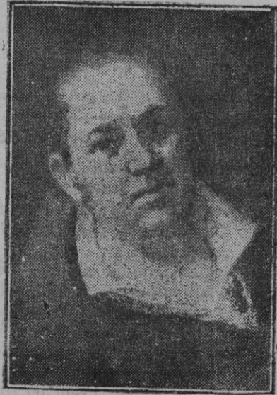
Autorretrato del genial pintor