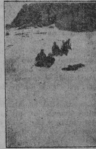
Fotografías que constituyen un interesante complemento gráfico de la atractiva reseña—que publicamos hace pocos días—de la excursión al Puig Major realizada por un grupo de distinguidos jóvenes de esta ciudad.