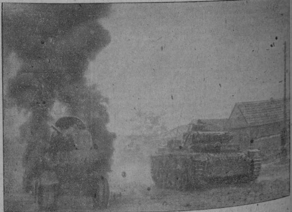
Una sección de tanques alemanes pasa por un pueblo ruso, incendiado por los rojos.

Muy cordialmente felicitamos a la dirección de la revista a quien auguramos grandes éxitos en la empresa editorial.