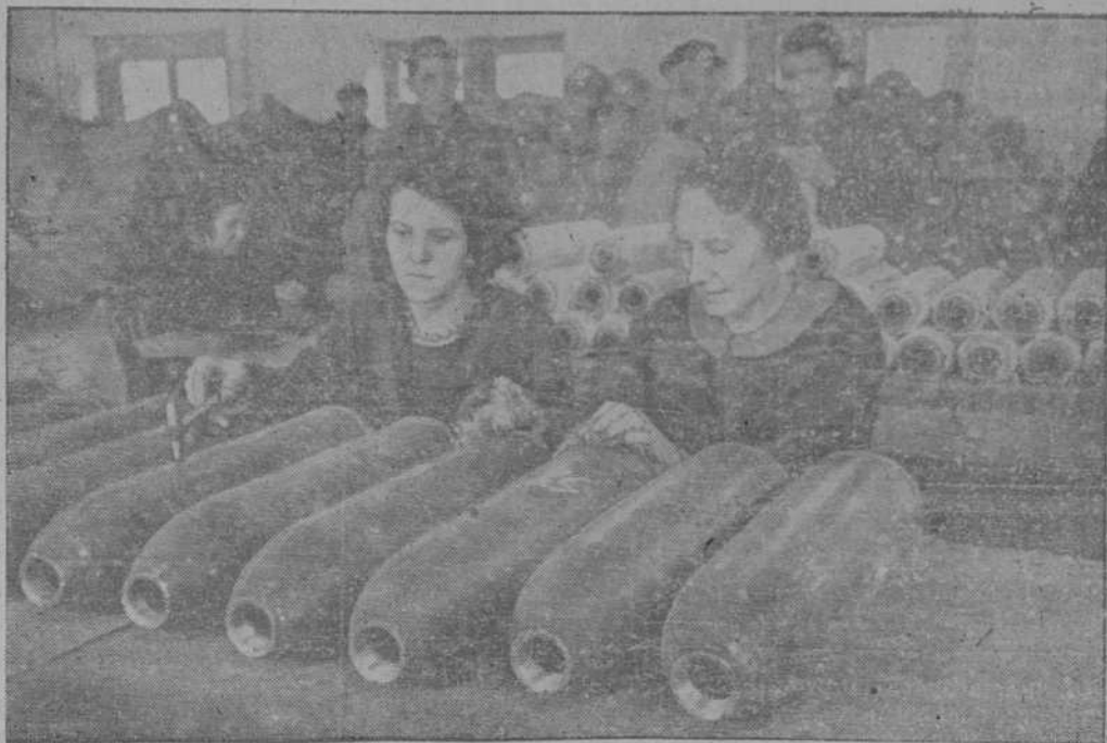
Mujeres alemanas en una fábrica de granadas

la enorme creación de KATHA RINE HEPBUEN, hablada en español y APTA PARA MENORES, la proyecta hoy el moderno CINE AVE. NIDA.