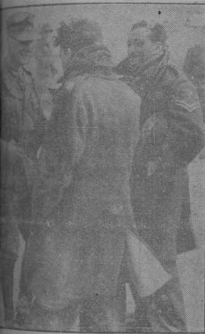
Los primeros prisioneros ingleses