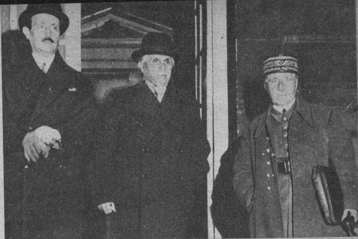
EL CONSEJO DE DEFENSA NACIONAL DE FRANCIA

M. Leger, secretario general del Ministerio de Negocios Exteriores, M. Paul Boncour, ministro de Negocios Exteriores, y el general Mellin, jefe del Estado Mayor del Ejército