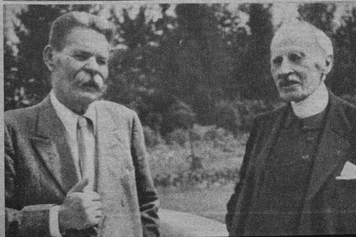
Máximo Gorki con el célebre escritor Romain Rolland