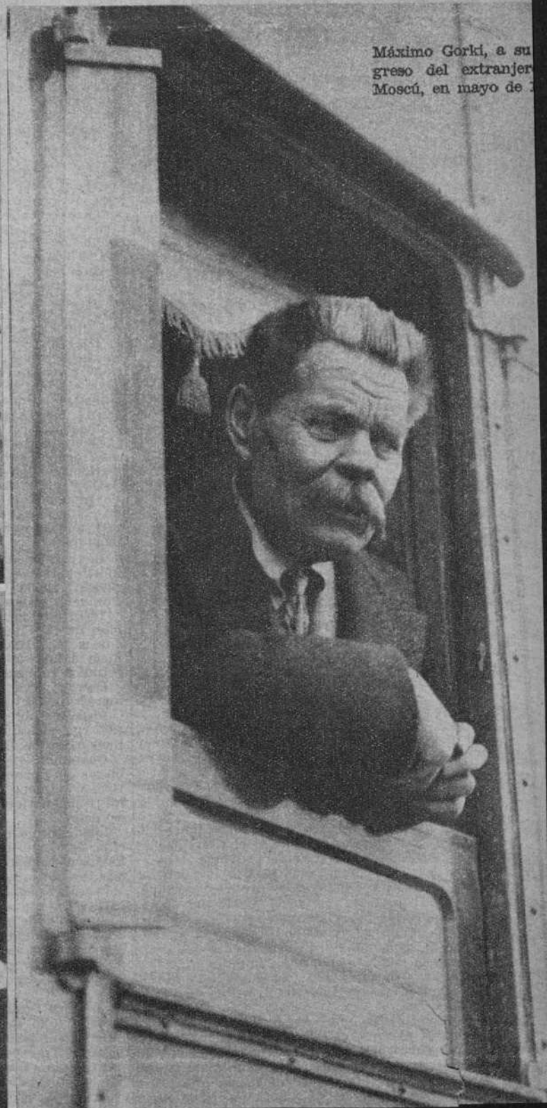
Máximo Gorki, a su regreso del extranjero Moscú, en mayo de 1913