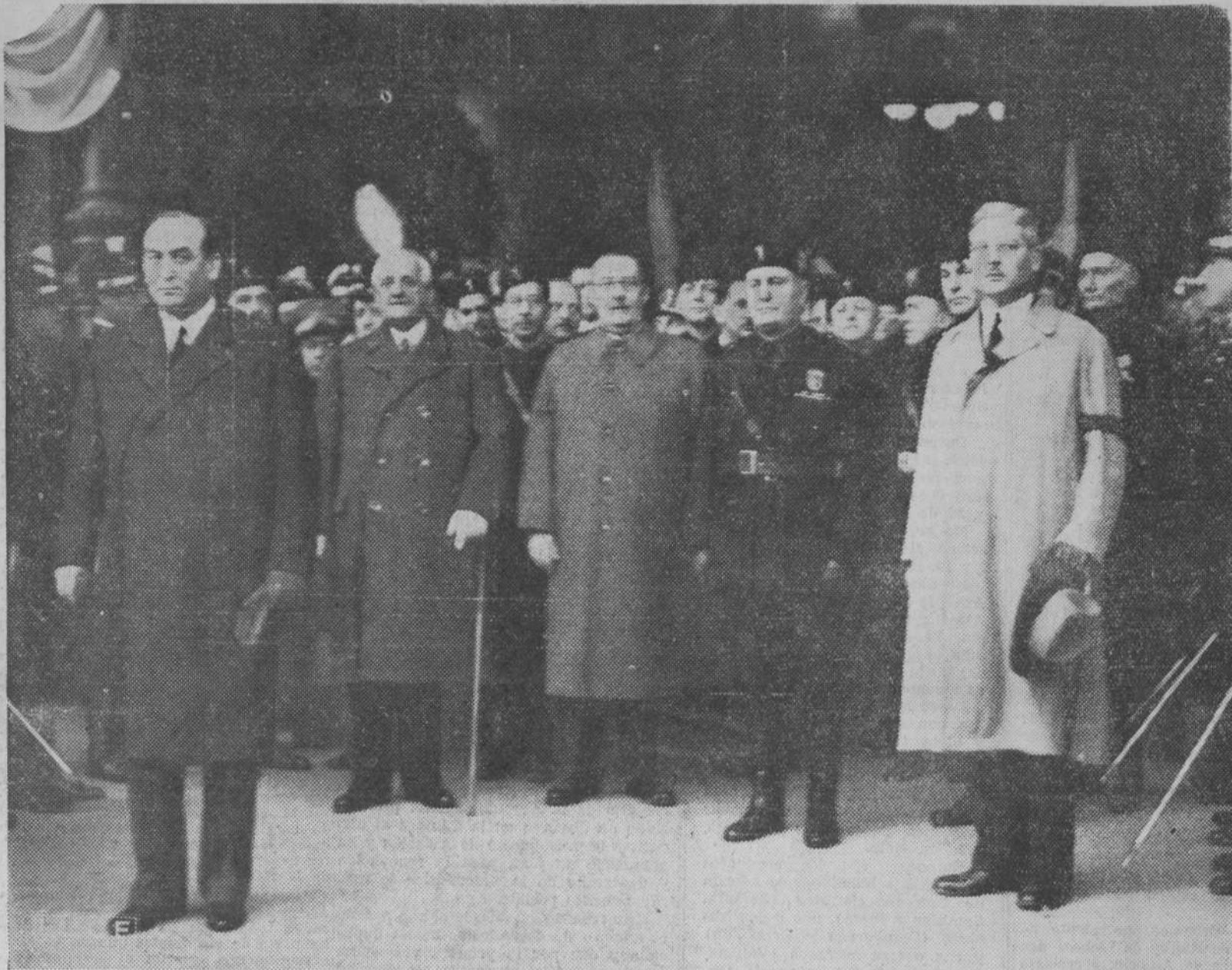
Llegada a Roma de los ministros de Austria y Hungría para la firma del Tratado con Italia. El "duce" acudió a la estación para darles la bienvenida