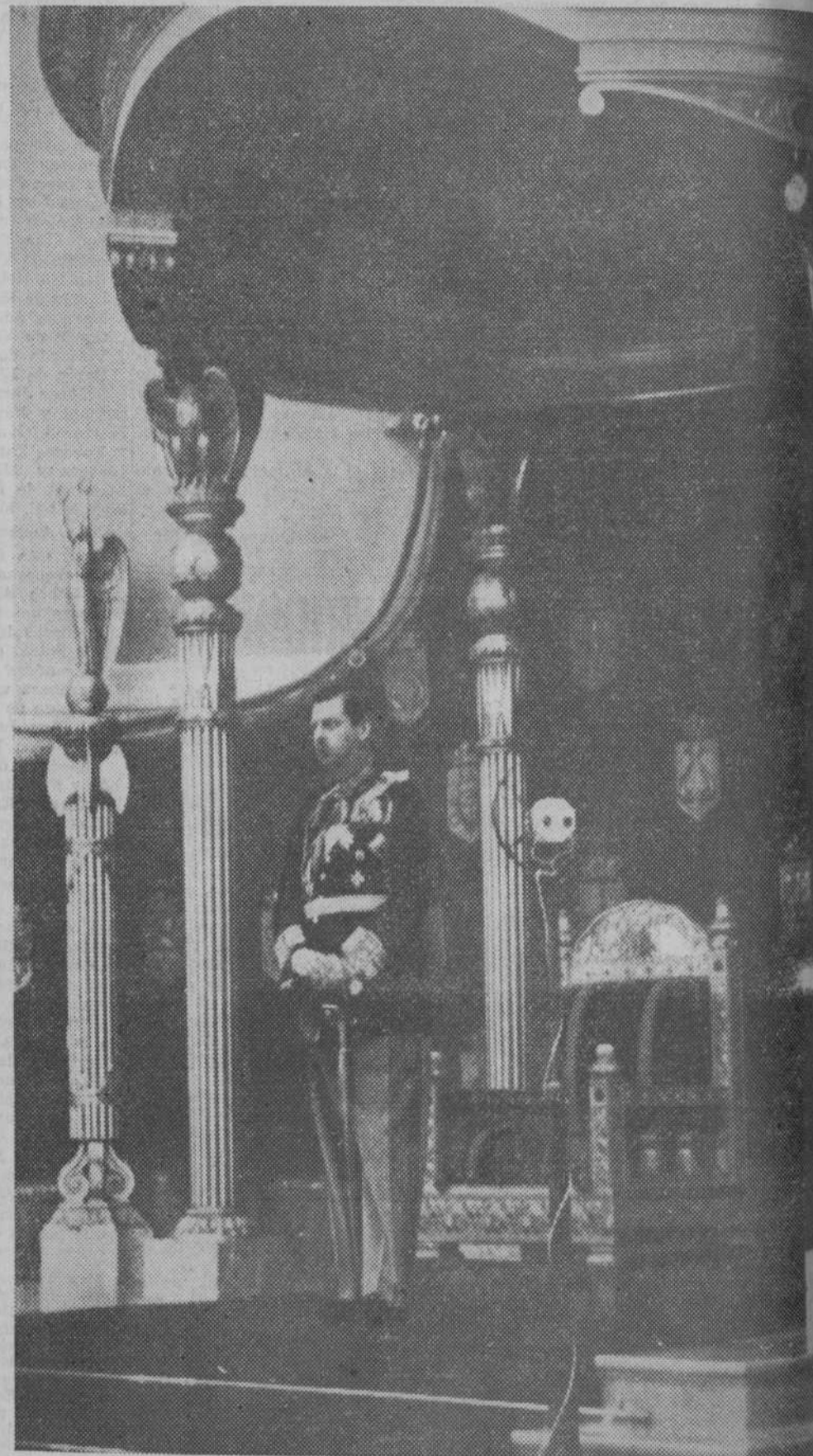
El rey Carol de Rumania, de pie ante el trono de rancia suntuosidad, que rima mal con el modernismo del indiscreto micrófono, habla a sus consejeros, invisibles en la fotografía