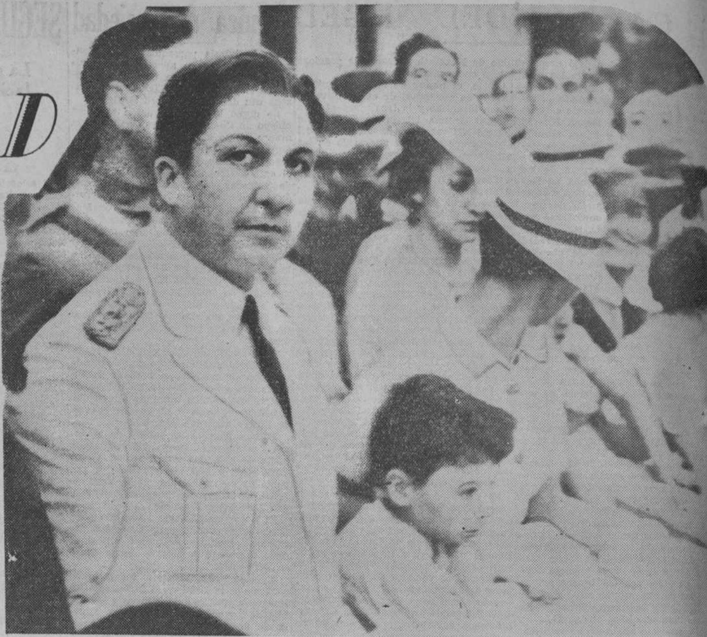
El héroe de la guerra del Chaco, general Franco, al salir del palacio presidencial de la Asunción, después de haber sido proclamado jefe del Gobierno militar del Paraguay, el primero de carácter fascista que se constituye en América