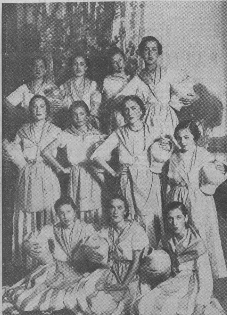
Señoritas pertenecientes a distinguidas familias cordobesas, que representaron un número de «La Canción de la Fuente», en un festival a beneficio del Ropero de Santa Teresita