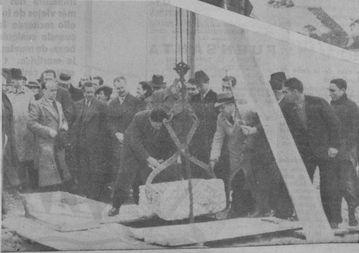
Momento de ser colocada la primera piedra del Sanatorio Antituberculoso para Funcionarios, que se levantará en terrenos de Valdeltas (Fuencarral). Arriba, bellas señoritas que asistieron al acto, contemplando la maqueta del Sanatorio