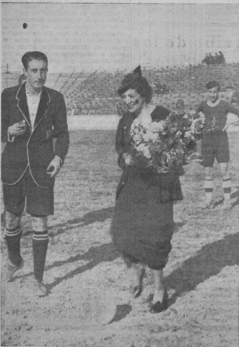
La fallera mayor de Valencia hace el saque de honor en uno de los partidos de «football» celebrados con motivo de las fallas