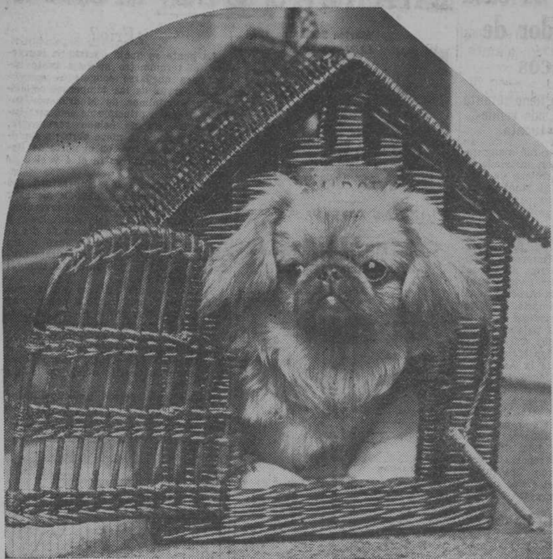
Este afortunado animalito ha ganado para él solo el puesto de honor en la Exposición de perros pequineses, que se acaba de celebrar en Londres