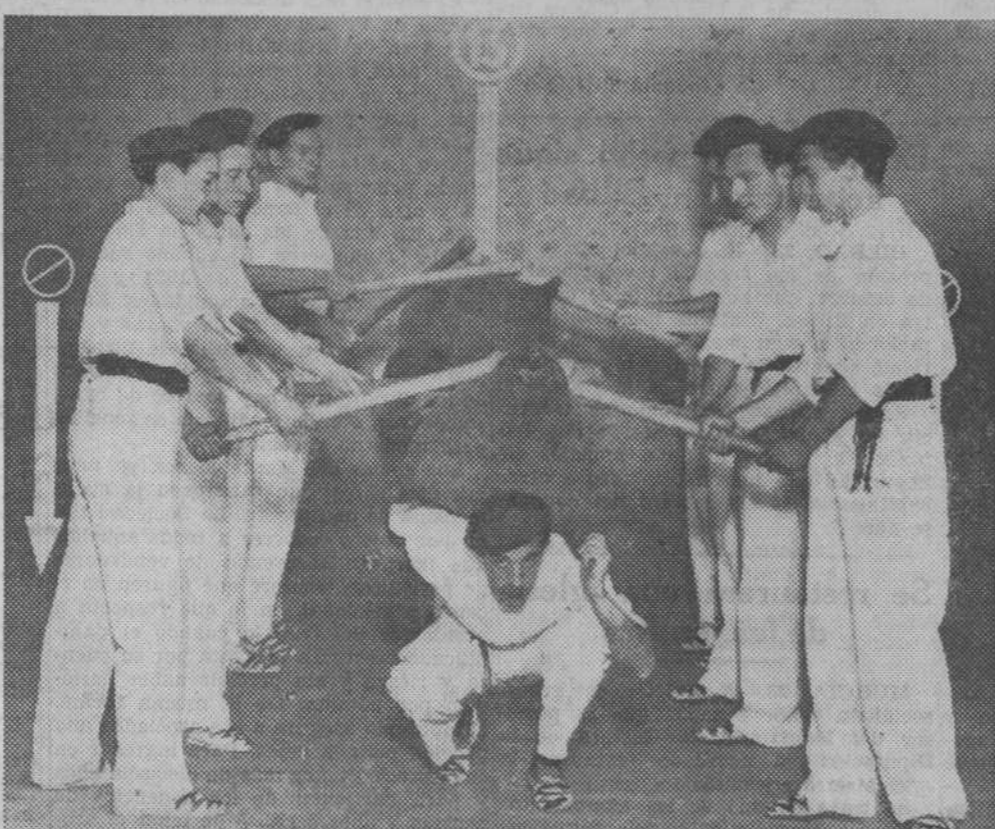
La Agrupación Vasca de Estudiantes celebró el domingo, en el Frontón Recoletos, una típica fiesta vasca. Véase, en la «foto» superior, un momento del baile de los pellejos, interpretado por jóvenes del Hogar Vasco. A la derecha, grupos de bellas muchachas que tomaron parte en el festival