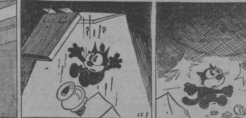
—Convocaré inmediatamente a los tra... —Apararé la luz para que no me vea... —Ahora sí que he metido las cuatro...