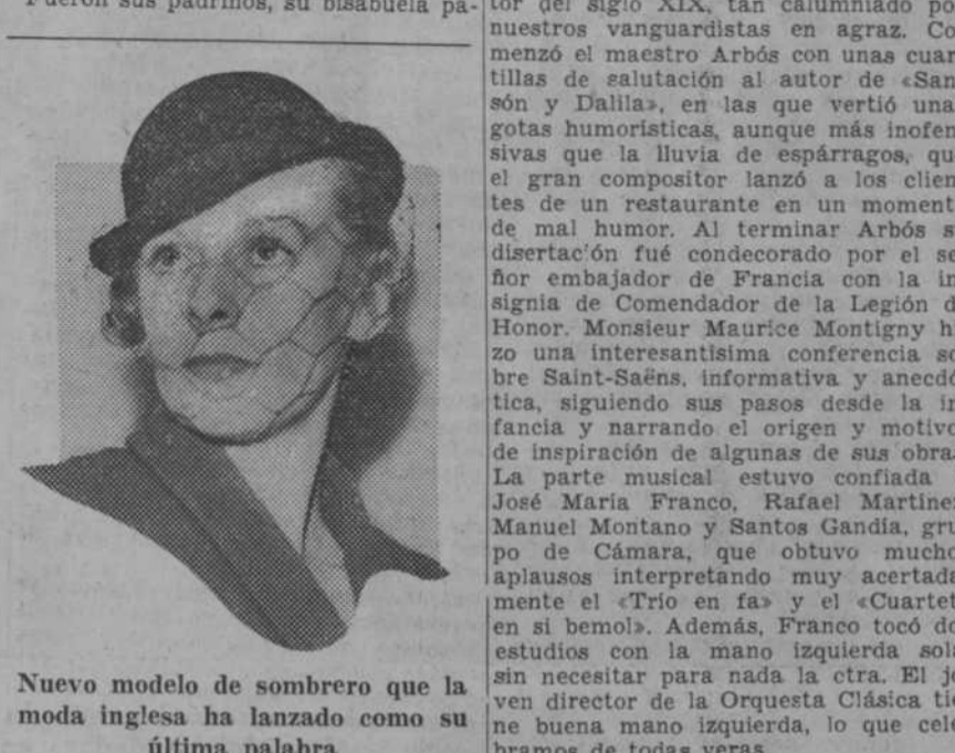
Nuevo modelo de sombrero que la moda inglesa ha lanzado como su última palabra.