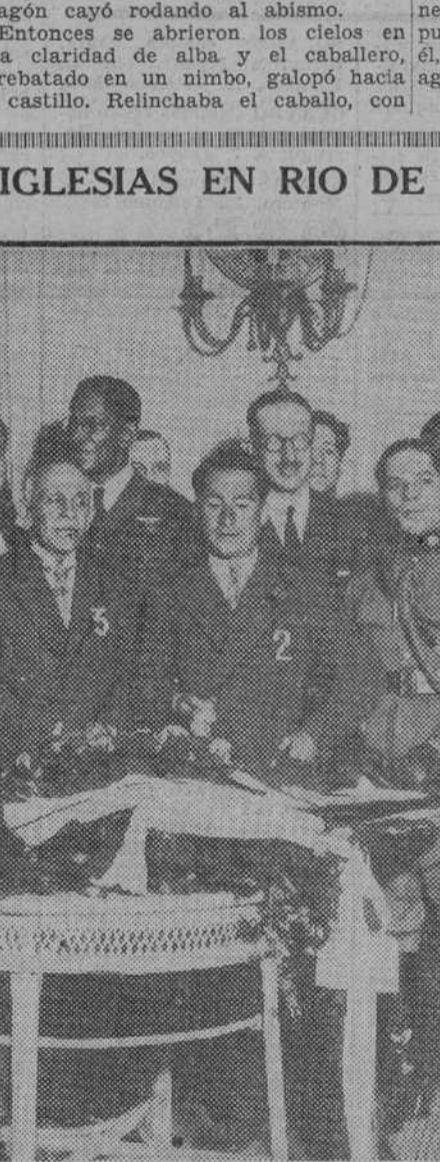
Los capitanes Jiménez (1) e Iglesias (2) con el aviador portugués almirante Gago Continho (3), que les visitó en el hotel donde se hospedaron.

Continúa sin resolver la crisis austriaca. El gobernador de Vorarlberg no acepta el encargo de formar Gobierno. VIENNA, 23.—En los círculos políticos se asegura que el doctor Ender, gobernador del Vorarlberg, ha declarado que no puede aceptar el cargo de canciller, de una manera definitiva. En vista de ello el partido cristiano social ha propuesto a los Comités ejecutivos de los otros dos partidos que forman con él la coalición gubernamental la candidatura del profesor Mittelberg, presidente de la administración de Hacienda de Vorarlberg.