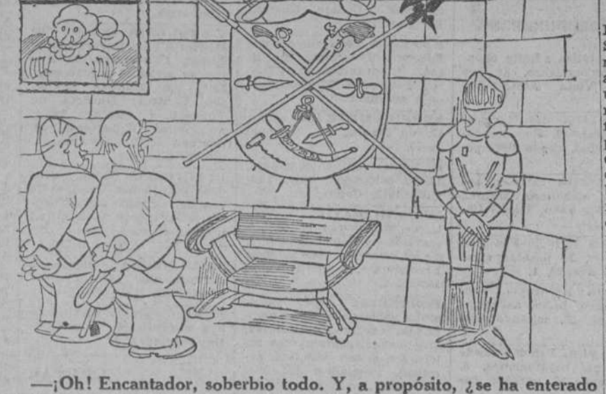
—¡Oh! Encantador, soberbio todo. Y, a propósito, ¿se ha enterado usted de esa riña de gitanos en Tetuán?