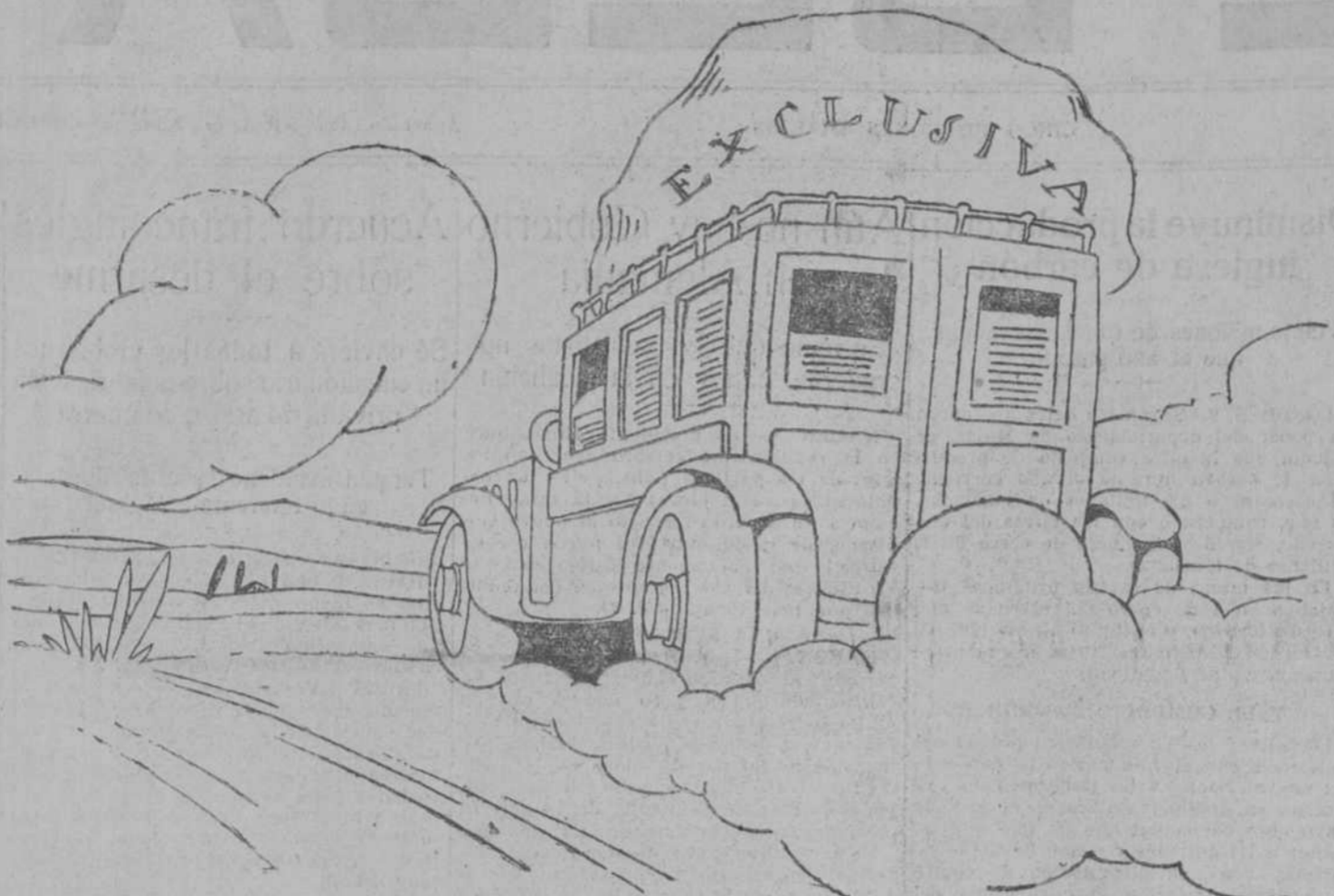
Exceso de equipaje.