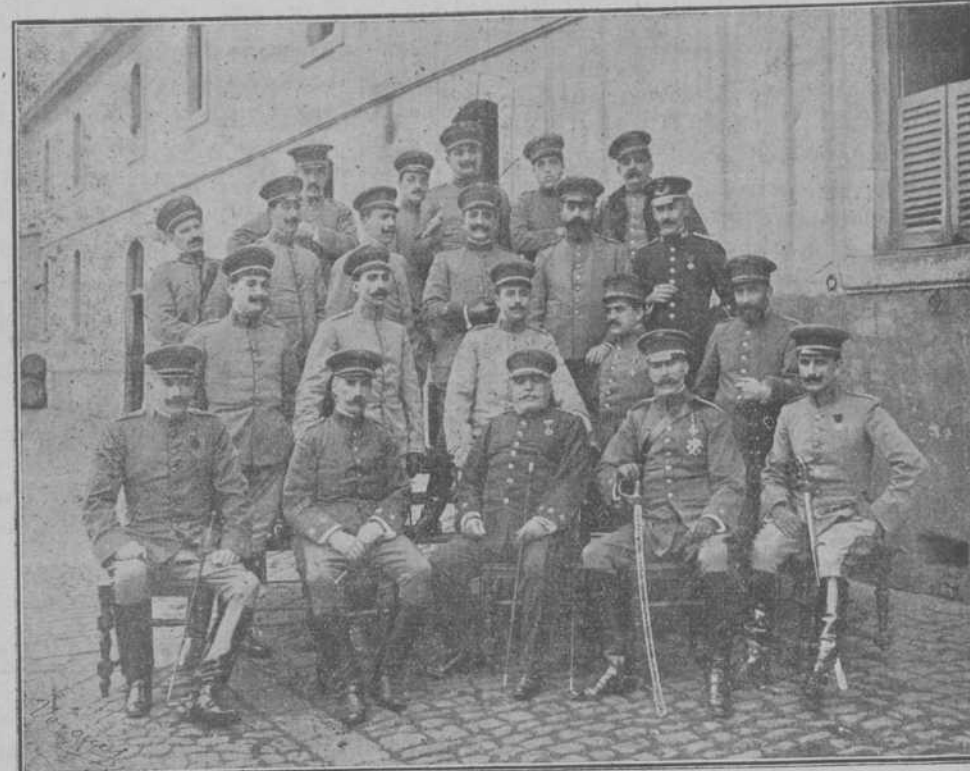
Jefes y oficiales del regimiento de dragones de Santiago.

Ahora, entre estas dos armas de combate en el mar, el torpedo automóvil, el de las flotillas; el cañón, el de los barcos de alto bordo; la primera le es particularmente favorable, la única aún que le da esperanzas y probabilidades de vencer; y la otra que condena necesariamente a su flota a ser abrumada bajo el número de sus adversarios y a sucumbir, finalmente, en pura pérdida, la Grecia ha elegido el segundo, cuyo único efecto debía ser dejarla tan impotente como antes, para hacer el menor bien a sus amigos