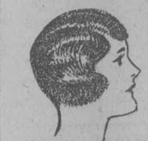
Stacomb domina el cabello y lo hace lucir en toda su plenitud.

PEINE y cepillo no son suficientes para hacer que el cabello se conserve peinado, y peinado debe mantenerse si se desea causar buena impresión personal. ¿Dice Ud. que lo humedece? Si, pero al evaporarse el agua, el cabello queda descolorido, quebradizo y falto, además, del aceite que le es natural. Las pomadas, aceites y brillantinas, — ya se sabe—dejan el cabello como una pasta: rígido y pastoso. Sin recurrir a los extremos, el hombre que se respeta a sí mismo debe, sin que por ello pierda un ápice de su masculinidad, aparecer limpio, pulcro y cuidadoso de su persona. Llevar el cabello hirsuto, descolorido y sin vida, no es limpio, ni pulcro ni cuidadoso. Stacomb, crema opalina, sutil, que se disipa después de usarla, conserva el cabello peinado todo el día, infundiéndole vida y prestándole brillo natural. Los árbitros de la elegancia en la escena y en el cine y un sinnúmero de comerciantes, deportistas, banqueros, oficinistas, etcétera, usan hoy Stacomb con la misma regularidad que el jabón, la pasta dental y la navaja de afeitar. Por más rebelde y herizado que sea el cabello, Stacomb hace que permanezca donde el peine y el cepillo lo colocan, aun después de lavarse la cabeza, que es cuando se muestra más terco e insumiso. Las damas hallan en Stacomb un medio ideal para retener en su lugar rizos y ondulaciones y el cabello recortado. Stacomb se halla de venta, en tubos y pomos, en farmacias y perfumerías. Sométalo a la prueba que ofrecemos gratuitamente.