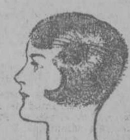
Stacomb domina el cabello y lo hace lucir en toda su plenitud.