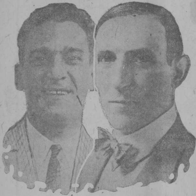
POUS Y GOMIS