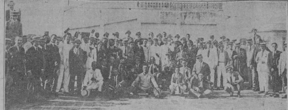
Los concurrentes a la fiesta celebrada por la Unión de Comerciantes al Detail de Sagua la Grande

Sagua, la pulcra villa del Undoso, orgullosa de su noble estirpe hispana, celebró de una manera digna la Fiesta de la Raza. Aunque ningún año, desde que se viene celebrando, ha dejado de hacerlo, cada vez con mayor entusiasmo, este año hizo un doble esfuerzo y como si hubiera querido compendiar la brillantez de los anteriores, aprovechó cada hora del día para que en ningún momento se debilitara el entusiasmo y el regocijo que había en todos los corazones.