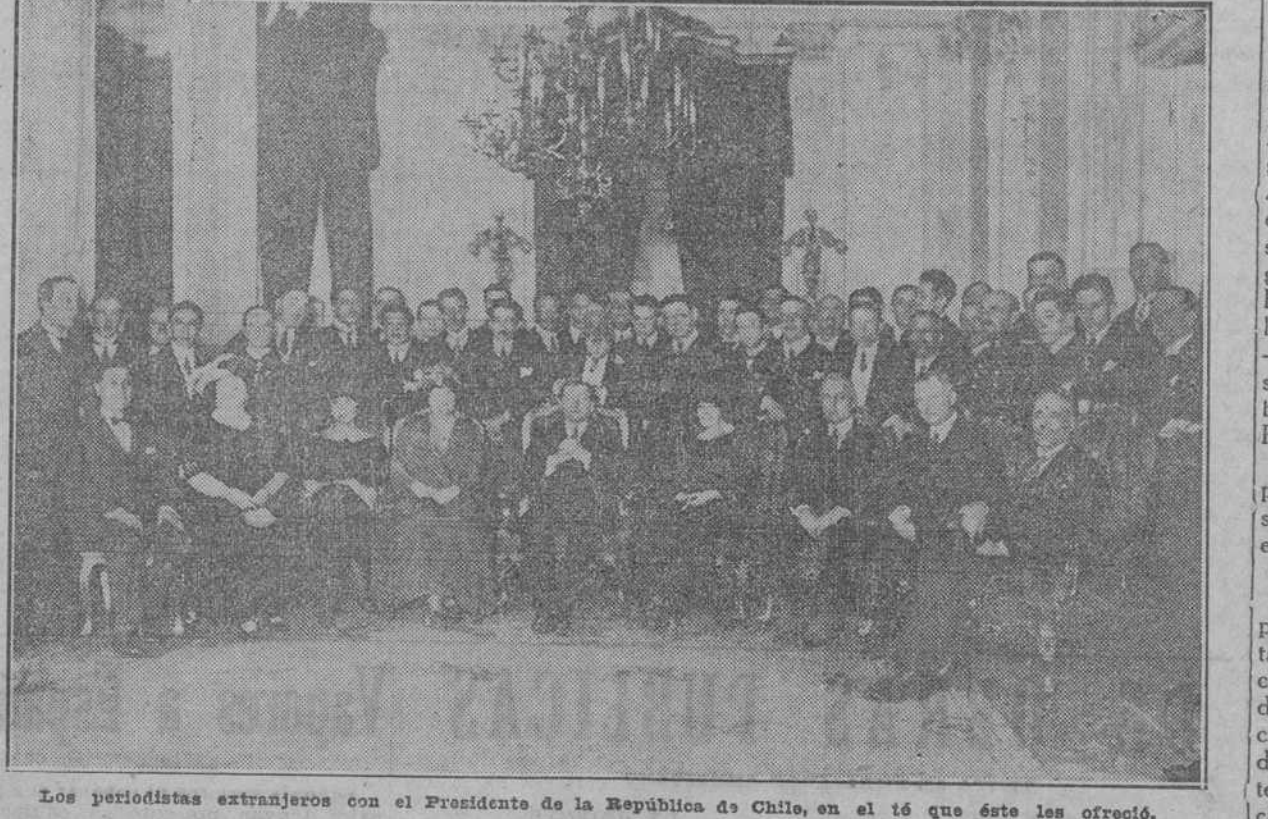
Los periodistas extranjeros con el Presidente de la República de Chile, en el té que éste les ofreció.

Las numerosas atenciones de que ha sido objeto los periodistas extranjeros que concurrieron a la V Conferencia de Santiago por la prensa local, por la Conferencia y la Sociedad Chilena, tuvo su coronamiento brillante en una recepción que nos ofreció el señor Presidente de la República de Chile, en el té que éste les ofreció.