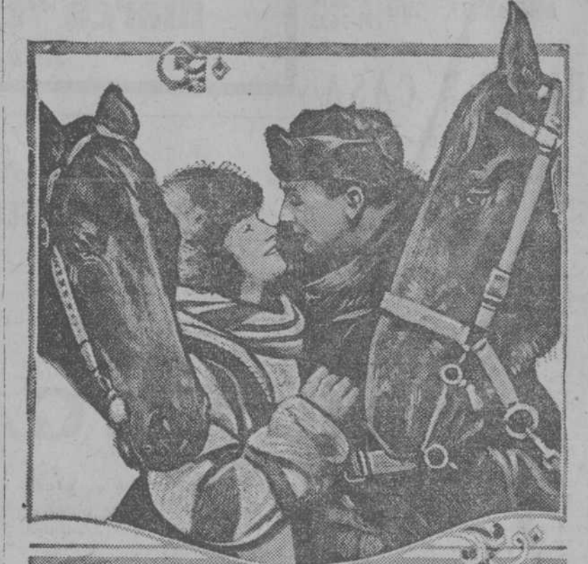
La bellísima actriz Betty Compson y el eminente actor Tom Moore en una escena de la interesante película "Over de Border" de la Paramount, basada en una historia de amor y aventura que tiene por campo de acción la nevada frontera canadiense.

Otros malvados de la pantalla no reciben semejantes insultos.— Cuando mi amigo Lon Chaney entra en lugar público, la gente lo mira con respeto. "Mira a Lon