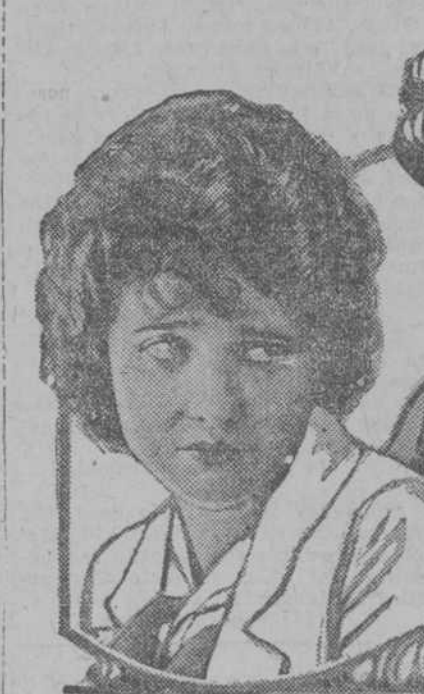
AGNES AYRES y Rodolfo Valentino en la película Paramount "The Sheik" de la que publicamos ya una interesante crónica firmada por el actor de moda.