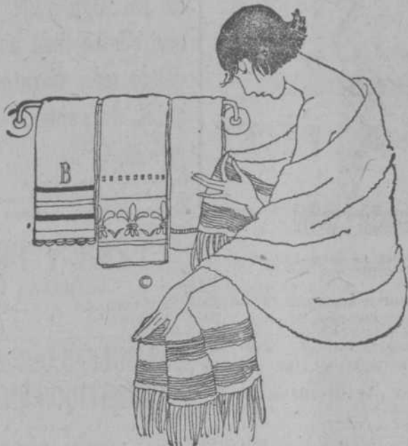
En la planta baja de Galiano y San Miguel encuentran ustedes cuanto puedan desear en toallas de todas clases, albornoces, batas de baño, etc., etc. Un surtido inmenso.

Ardieron anoche, al dar las nueve, constituyendo el espectáculo de una multitud inmensa agolpada a lo largo de la primera avenida de la capital.