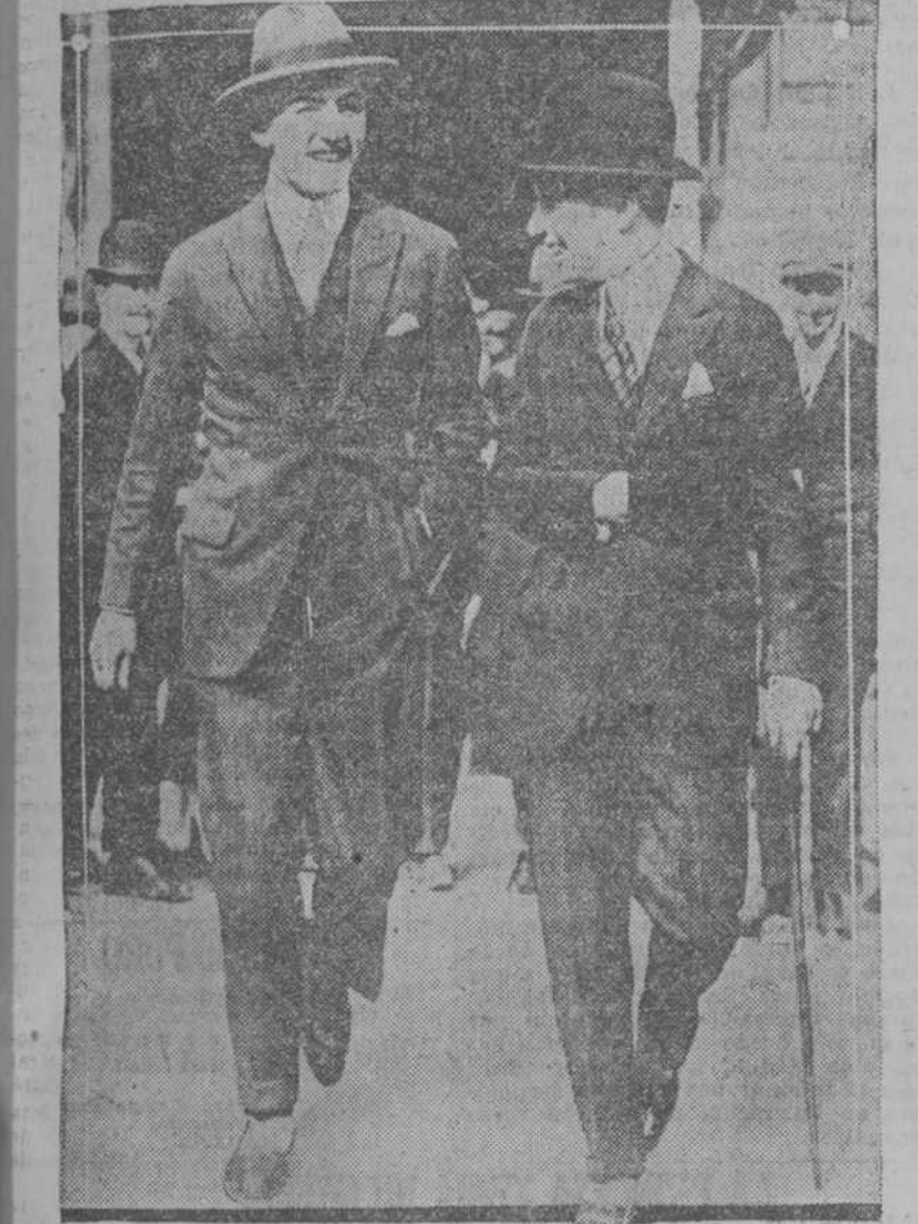
Charles Chaplin y Georges Carpentier (el del bastón), retratados al salir juntos del Hotel Claridge, en París.