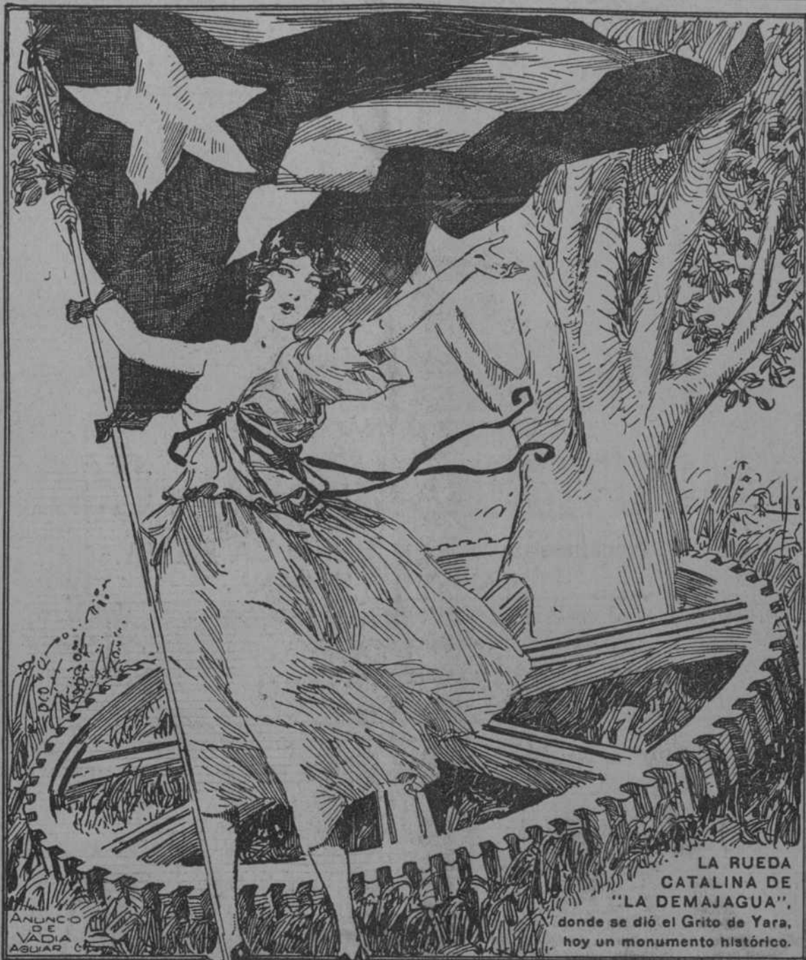
LA RUEDA CATALINA DE "LA DEMAJAGUA", donde se dió el Grito de Yara, hoy un monumento histórico.