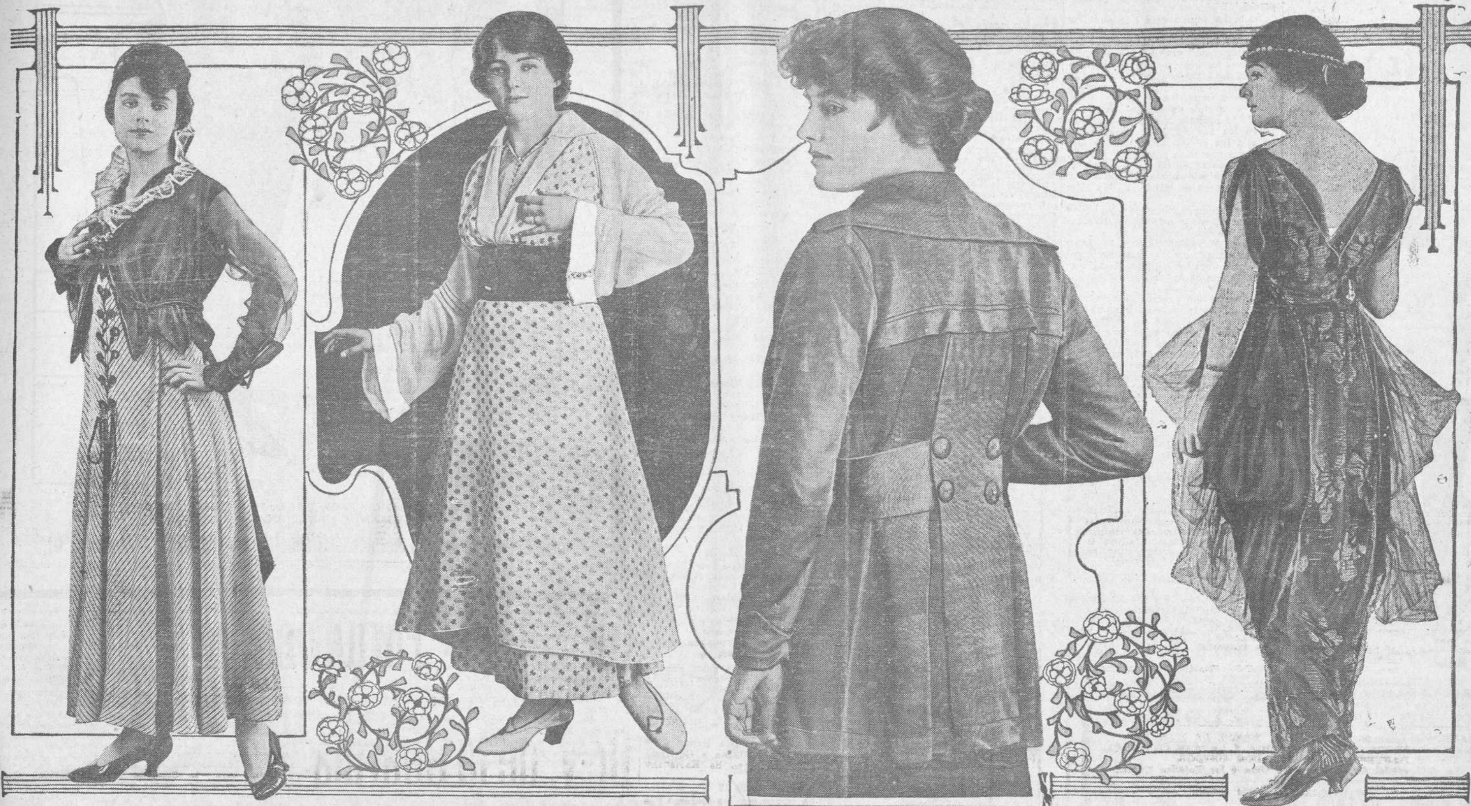
Estos son los Modelos más Preferidos por los Elegantes de New York

Variedad de Trajes de Distintas Formas y Hechuras y para Diversos Usos