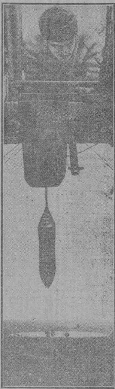
Un aviator francés utilizando el lanza-bombas inventado por el teniente Scott desde una altura de 300 metros.

DOS BARCOS DE GUERRA ENTRAN EN SHANGHAI Londres, 14. Un despacho de El Aguiar dice que