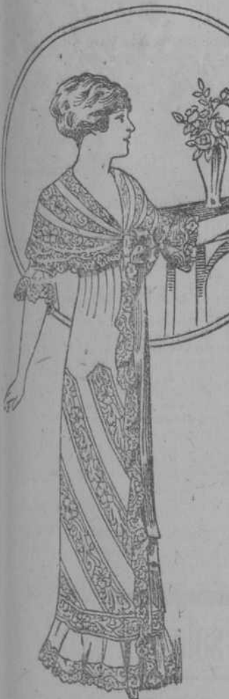
Elegante y moderna bata de nansú francés y finos encajes a $5.98.