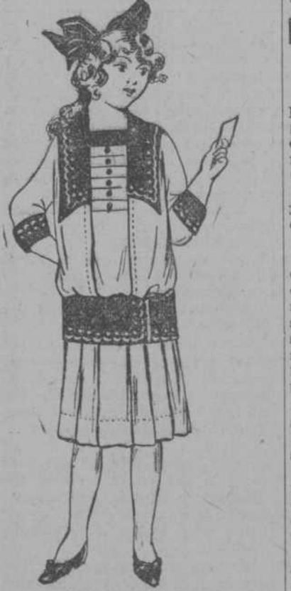
Vestido, forma moderna, de warandol blanco, con adornos tela de color, con bordados y festones. Desde $1.98 para 8 años.