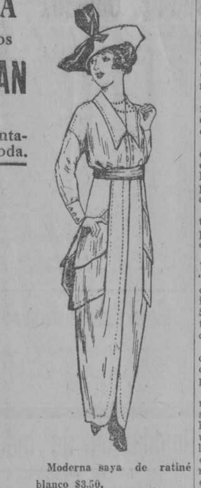
Moderna saya de ratine blanco $3.50.

SABANAS CAMERAS CON DOBLADILLO DE OJO, A UN PESO. FUNDAS A VEINTICINCO CENTAVOS.