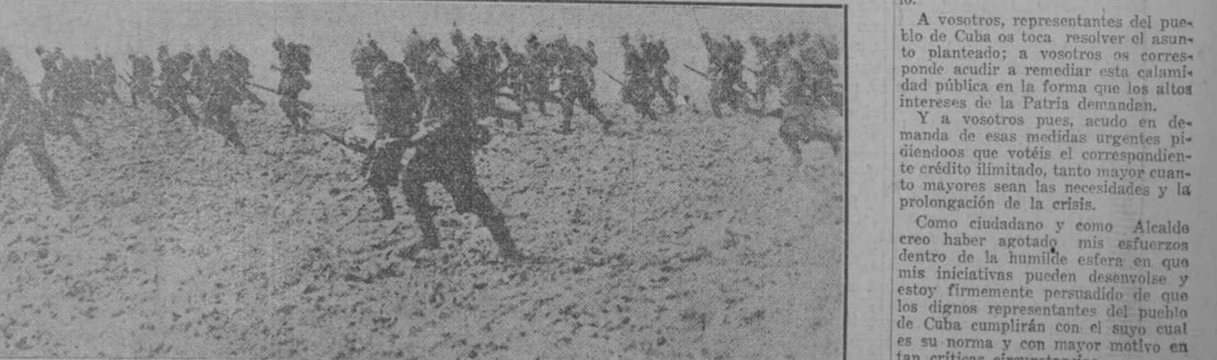
La infantería alemana en la línea de escaramuzas.