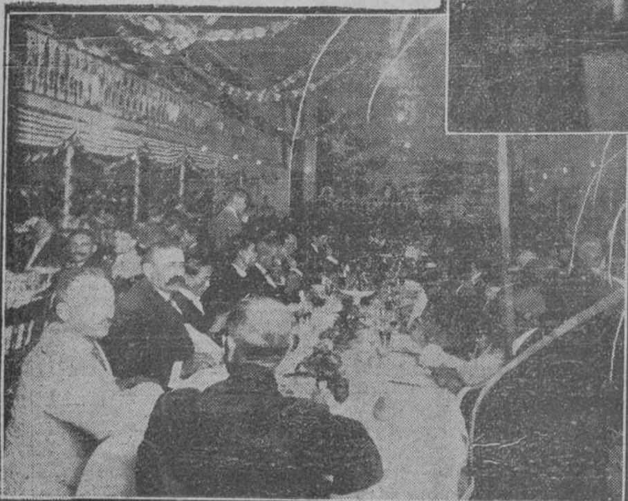
Un aspecto del banquete.

La actualidad gráfica Unquete en honor del general Nodarse, en Pinar del Río