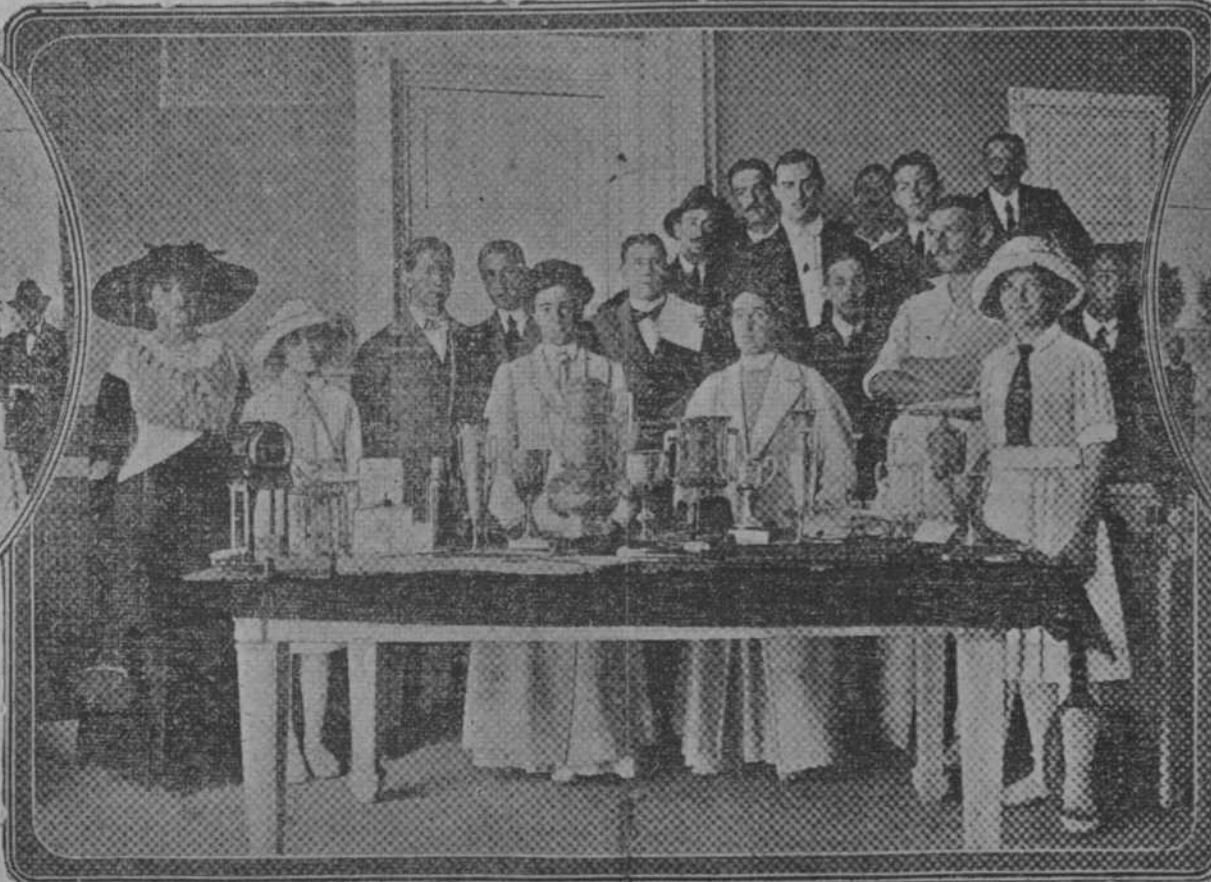
Jugadores que han tomado parte en el Concurso Internacional de lawn-tennis, celebrado en Barcelona.