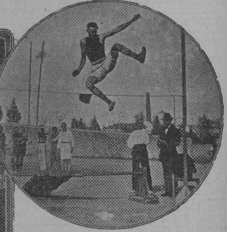
Festival celebrado en Barcelona: Otro salto de trampolín en el mismo campo de deportes.