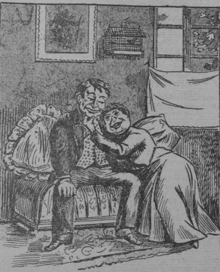
—¡No es verdad, cielo mío, que seré siempre tu Mimí-Pínson? (De Jear qui rit, de París.)