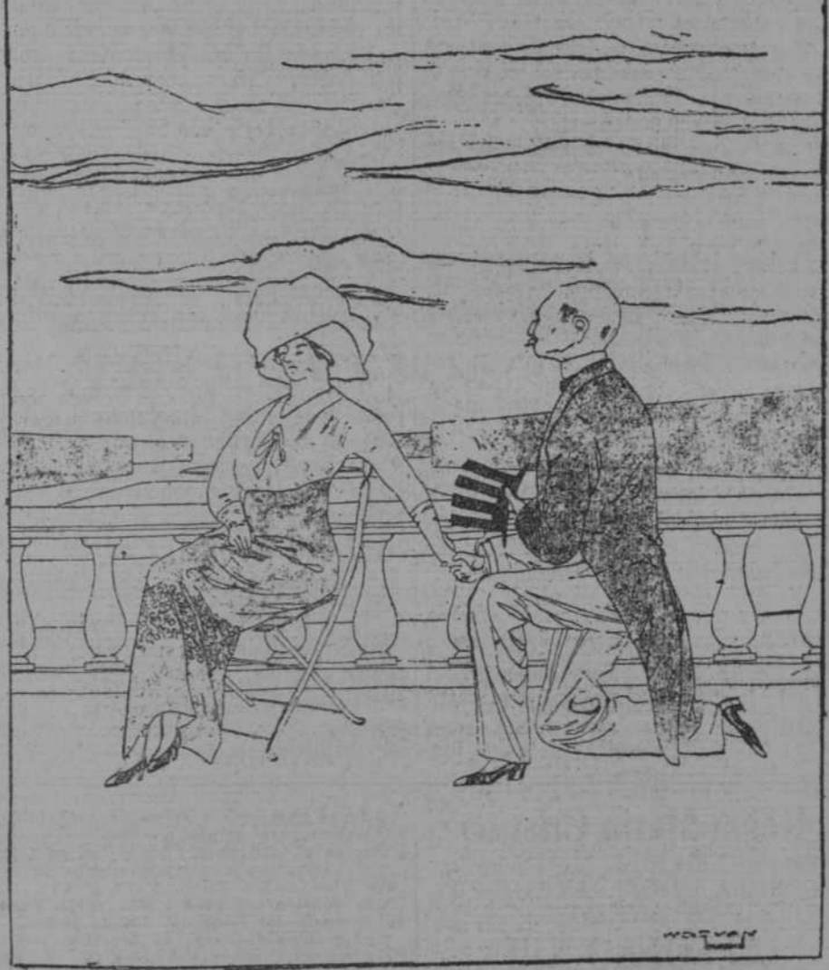
—En qué piensa usted, rubia divina? —En que no sé si será un par de botetas ó un puntapié en el remate de la espalda lo que le dará á usted mi marido cuando llegue dentro de un momento y le encuentre en esa postura. (Del Sourire, de París.)