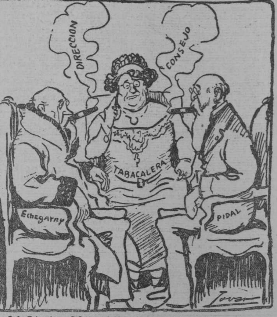
Doña Tabacalera.—Señores, esto va mal. Estamos dando el tabaco malo y caro. Los Consejeros.—¡Caramba! Pues estas brevas que nosotros fumamos no son tan malas...