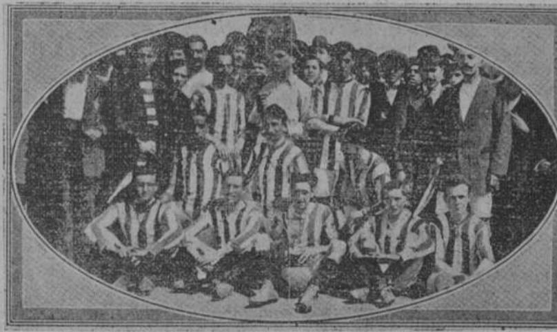
Equipo de foot-ball de Sevilla que jugó un partido interesantísimo con el team de Jerez, ganando la copa donada por el alcalde de la capital andaluza.