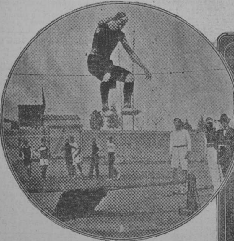
Festival celebrado en Barcelona: Salto de trampolín en el campo de deportes del "Centre Autonomista del Comerç y de la Indústria"