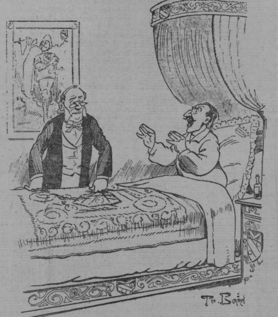
—¿Qué dice usted, Doctor? ¡Ponerme á mí sanguijuelas! ¡Dejarme chupar la sangre por esos bichos asquerosos! ¡Pero Doctor, fíjese usted en que es sangre de Godofredo de Bouillon la que corre por mis venas... (De Pêle-Mêle, de París.)