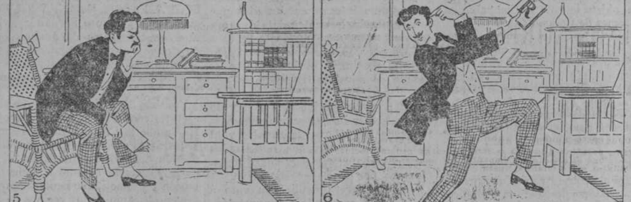
5 Pero, señor, ¿qué tendrá, Mi política mamá? 6 Apuesto á que la cuestión Es de mala digestión!