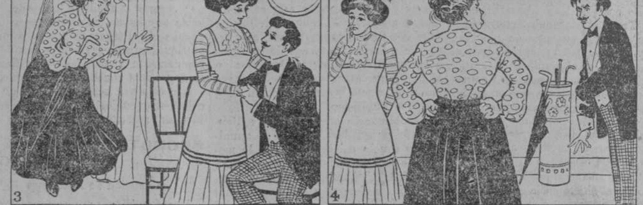
3 Y ni á su hija perdona Que se muestre coquetona. 4 De aquel hogar, en verdad, Huyó la tranquilidad.