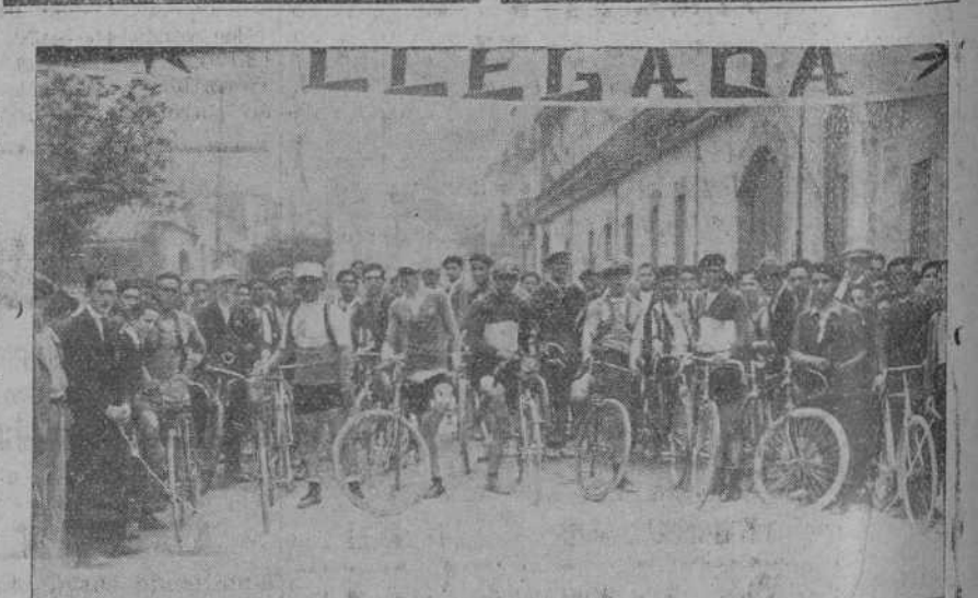
TORRELAVEGA.—Los corredores que tomaron parte en la carrera ciclista celebrada el miércoles, momentos antes de comenzar la prueba.

En su Caja de Ahorros se abona el 3 por 100 de interés anual, sin limitación de cantidad y cualquier día se da operación de Banca es llevada a cabo por dicho Banco con la mayor competencia.