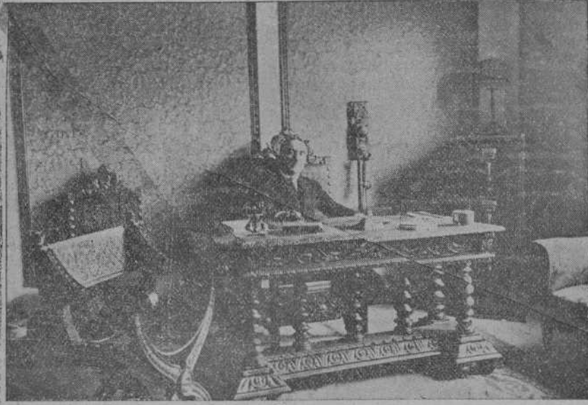
EL BANCO DE TORRELAVEGA.—Lujoso y elegante despacho del director.