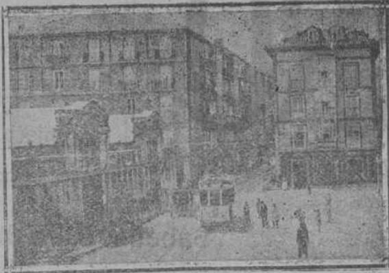
CALLE DE ATARAZANAS